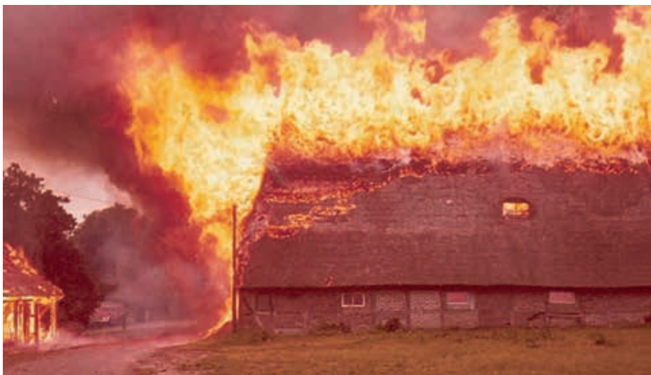
Brennende Reetdächer des ehemaligen Kanzleigutes