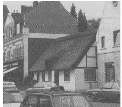
Das kleine Haus Nienstedtener Straße 1 vor dem Brand

Tage später, am 2. März, brannte nachts im Haus des großen Stallge-