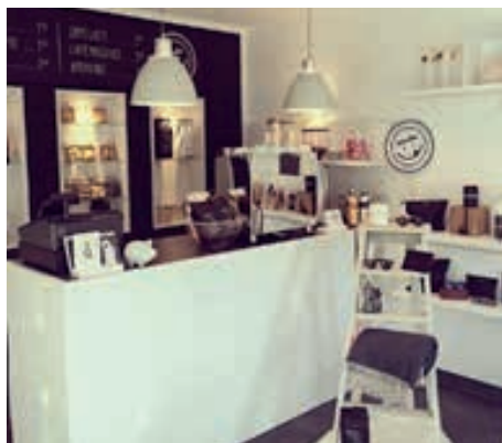
Ein Blick in den Laden

Das Angebot ist sehr umfangreich: Wohnaccessoires, Taschen, Sonnenbrillen, Damenmoden, Hunde-