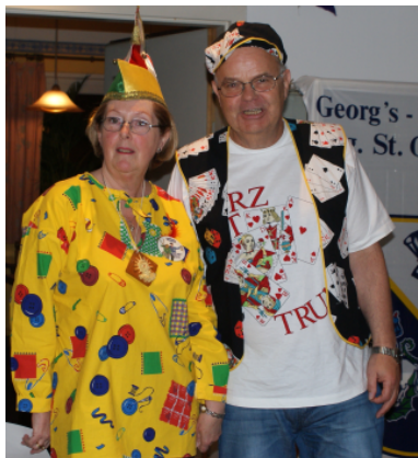
Das Deko-Team „unten“ mit junger Unterstützung!