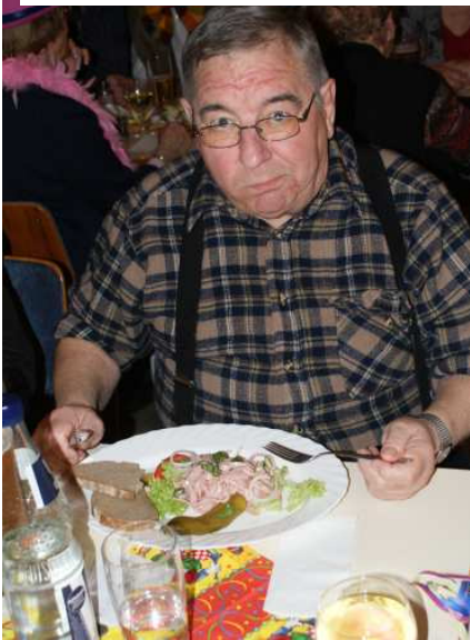
Der Herr des badischen Wurstsalat