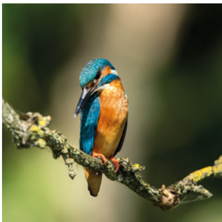
In den Hamburger Vier- und Marschlanden gibt es noch artenreiche Gräben, an denen auch der Eisvogel vorkommt.