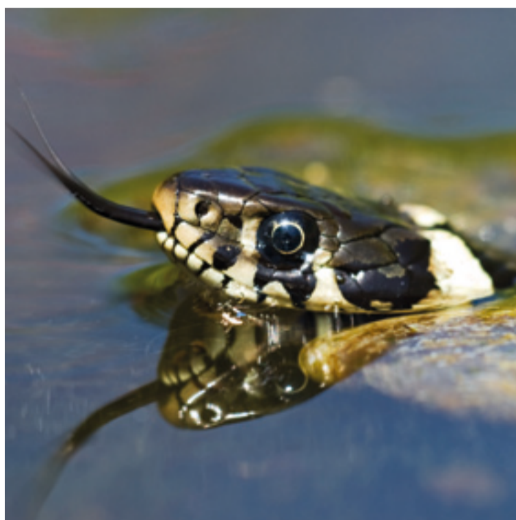
Das Pfeilkraut verdankt seinen Namen der markanten Form seiner Blätter. Im Wasser sucht eine Ringelnatter nach Nahrung.