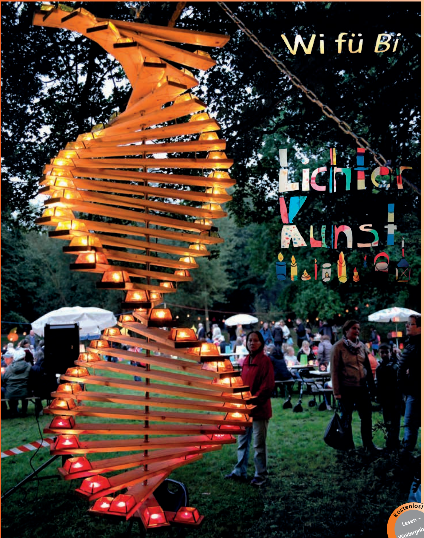
Zur LichterKunst erstrahlt er wieder: Der Schleemer Park am 16. September

Zeitschrift des Bürger- und Kommunalvereins Billstedt von 1904