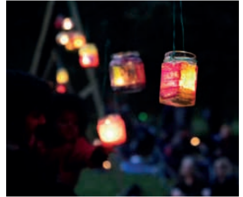
die LiKu in der Dämmerung bringt ein Leuchten in die Augen...

andere nette Leute beleuchten. Machen Sie es ihm nach. Beleuchten Sie für Ihre Familie, Ihre Sportgruppe oder Freunde Ihren „eigenen“ Tisch. Am Namen LichterKunst wird weiter festgehalten, auch wenn nicht