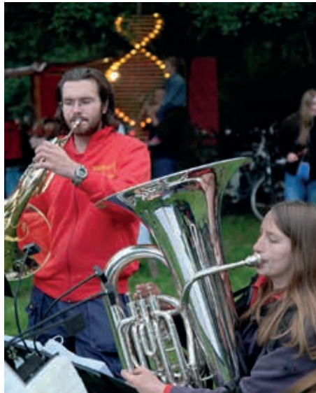
Die BilleBläser werden die LiKu eröffnen

Am Freitag, dem 16. September, veranstaltet die Initiative „Wir für Billstedt“ wieder einmal die „LichterKunst im Schleemer Park“. Nach dem Motto „Mitmachen und genießen“ sind alle Gäste herzlich eingeladen, den Park ab 18 Uhr gemeinsam mit selbst gebastelten Lichtobjekten zu schmücken. „Wir hoffen, dass viele Besucher kreativ werden und ihre eigenen Lichtobjekte (kerzenbeleuchtet) mitbringen. Für genügend Sitzplätze und Tische ist gesorgt, an denen es sich die Besucher mit ihrem mitgebrachten Picknick gemütlich machen können“, sagen die Organisatoren. Nach dem Entzünden der Kerzen sorgen gegen 19.15 Uhr die BilleBläser für die musikalische Eröffnung. Wieder dabei ist dieses Jahr die Rockband RisOtto , die vor dem Spielhaus in die Saiten greift. Auch dieses Jahr wird der Bürgerverein Billstedt zwei Tische für sich und