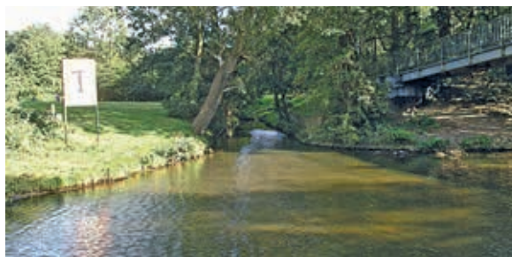
Mündung des Schlemer Baches in die Bille

Wollen auch Sie Gewinner dieses schönen Preises werden, beantworten Sie bitte folgende Fragen zum heutigen Rätselbild: Zu sehen ist ein Gemüseladen in der Steinbeker Hauptstraße im Jahr 1961: Was ist mit dem Laden und dem Gebäude geschehen, welches Gebäude steht evtl. heute an seiner Stelle?