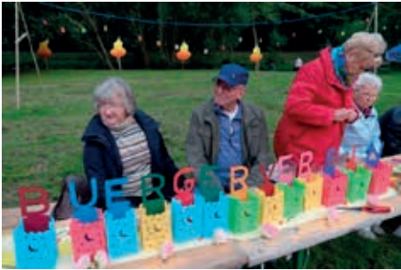
eigener Tisch ist des Leuchtens wert...