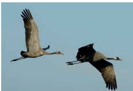
Kraniche im Flug