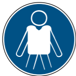
WSW001 Rettungsweste benutzen 11