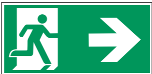
Beispiel für Rettungsweg/Notausgang (E002) mit Zusatzzeichen (Richtungspfeil)