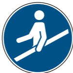
M012 Handlauf benutzen