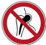
P014 Kein Zutritt für Personen mit Implantaten aus Metall