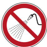
P016 Mit Wasser spritzen verboten 5