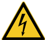
W012 Warnung vor elektrischer Spannung