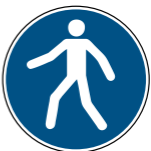
M024 Fußgängerweg benutzen