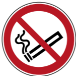
P002 Rauchen verboten