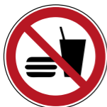
P022 Essen und Trinken verboten