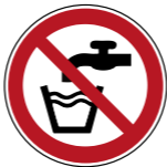
P005 Kein Trinkwasser