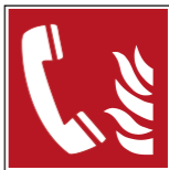
F006 Brandmelde- telefon