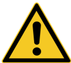
W001 Allgemeines Warnzeichen 6