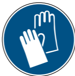
M009 Handschutz benutzen