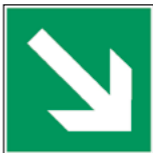
Richtungspfeile für Rettungszeichen sowie für Mittel und Einrichtungen zur Ersten Hilfe 12