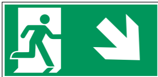
Beispiel für Rettungsweg/Notausgang (E002) mit Zusatzzeichen (Richtungspfeil)