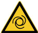
W018 Warnung vor automatischem Anlauf