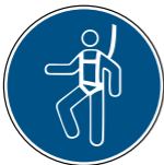
M018 Auffanggurt benutzen