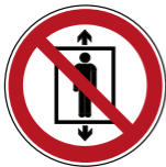
P027 Personenbeförderung verboten