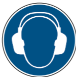
M003 Gehörschutz benutzen