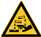
W023 Warnung vor ätzenden Stoffen