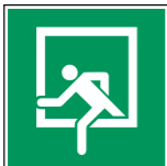
D-E019 Notausstieg 14