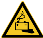
W026 Warnung vor Gefahren durch das Aufladen von Batterien