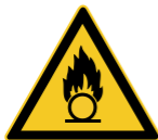
W028 Warnung vor brandfördernden Stoffen