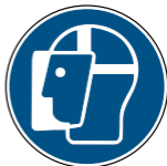
M013 Gesichtsschutz benutzen