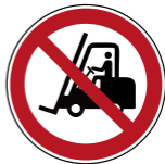
P006 Für Flurförderzeuge verboten