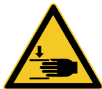
W024 Warnung vor Handverletzungen