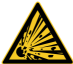
W002 Warnung vor ex- plosionsgefähr- lichen Stoffen