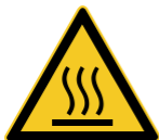
W017 Warnung vor hei- ßer Oberfläche