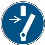
M021 Vor Wartung oder Reparatur freischalten