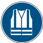
M015 Warnweste benutzen