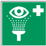
E011 Augenspülein- richtung