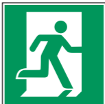
E002 Rettungsweg/ Notausgang (rechts) 13