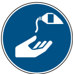
M022 Hautschutzmit- tel benutzen