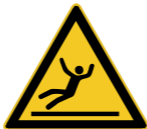
W011 Warnung vor Rutschgefahr