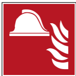
F004 Mittel und Geräte zur Brandbe- kämpfung