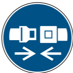
M020 Rückhaltesystem benutzen