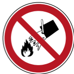
P011 Mit Wasser löschen verboten