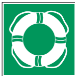
WSE001 Öffentliche Rettungsaus- rüstung 14