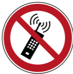
P013 Eingeschaltete Mobiltelefone verboten