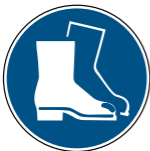
M008 Fußschutz benutzen