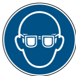
M004 Augenschutz benutzen