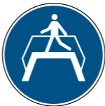
M023 Übergang benutzen