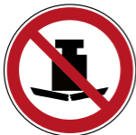
P012 Keine schwere Last 3