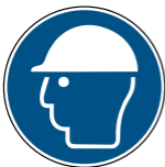
M014 Kopfschutz benutzen