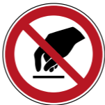
P010 Berühren verboten