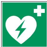
E010 Automatisierter Externer Defibril- lator (AED)