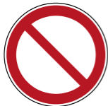
P001 Allgemeines Verbotsszeichen 1