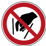
P015 Hineinfassen verboten