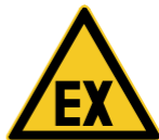
D-W021 Warnung vor explosionsfähiger Atmosphäre 8