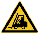
W014 Warnung vor Flurförderzeugen