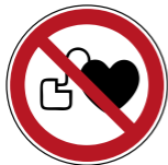
P007 Kein Zutritt für Personen mit Herzschrittmachern oder implantierten Defibrillatoren 2