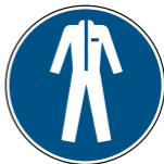
M010 Schutzkleidung benutzen