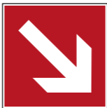
Richtungspfeile für Brandschutzzeichen 9