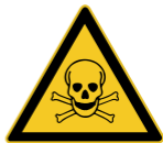
W016 Warnung vor giftigen Stoffen