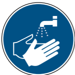
M011 Hände waschen