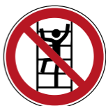
D-P022 Besteigen für Unbefugte verboten 5