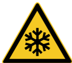
W010 Warnung vor niedriger Temperatur/ Frost