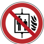
P020 Aufzug im Brandfall nicht benutzen