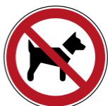
P021 Mitführen von Hunden verboten 4