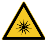
W027 Warnung vor optischer Strahlung