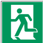
E001 Rettungsweg/ Notausgang (links) 13