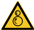
W025 Warnung vor gegenläufigen Rollen 7