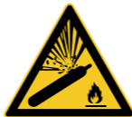
W029 Warnung vor Gasflaschen