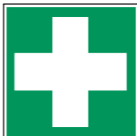
E003 Erste Hilfe