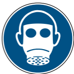
M017 Atemschutz benutzen