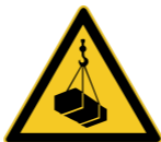
W015 Warnung vor schwebender Last