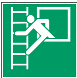
E016 Notausstieg mit Fluchtleiter