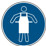
M026 Schutzhürze benutzen