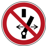
P031 Schalten verboten