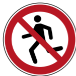
WSP001 Laufen verboten 5