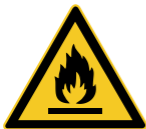
W021 Warnung vor feuergefährlichen Stoffen