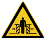
W019 Warnung vor Quetschgefahr