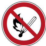
P003 Keine offene Flamme; Feuer; offene Zündquelle und Rauchen verboten