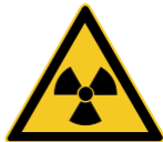
W003 Warnung vor ra- dioaktiven Stoffen oder ionisieren- der Strahlung