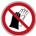
P028 Benutzen von Handschuhen verboten