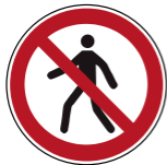
P004 Für Fußgänger verboten