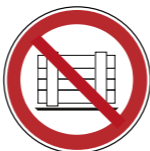
P023 Abstellen oder Lagern verboten