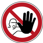
D-P006 Zutritt für Unbefugte verboten 5