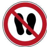
P024 Betreten der Fläche verboten