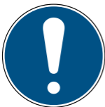
M001 Allgemeines Gebotszeichen 10