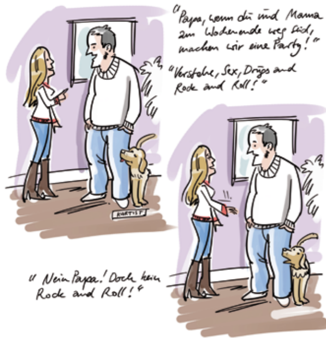
© BJÖRN UND ARIST VON SCHLIPPE