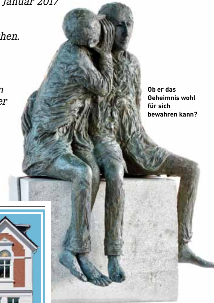
Ob er das Geheimnis wohl für sich bewahren kann?