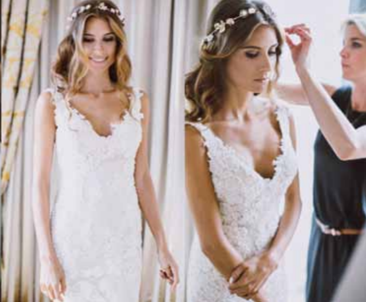
Beim Brautstyling von Cathy Hummels