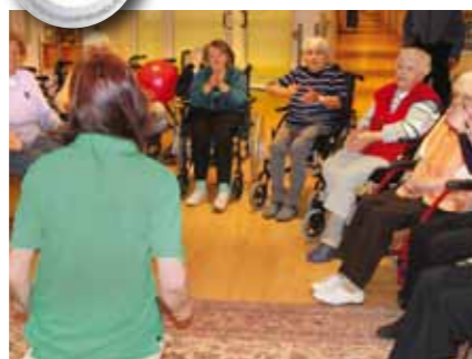
Sitzgymnastik zur Unterstützung der Beweglichkeit und Mobilisation

Am Hegen 29, Tel. 67 37 04-0, www.seniorenitz-am-hegen.de