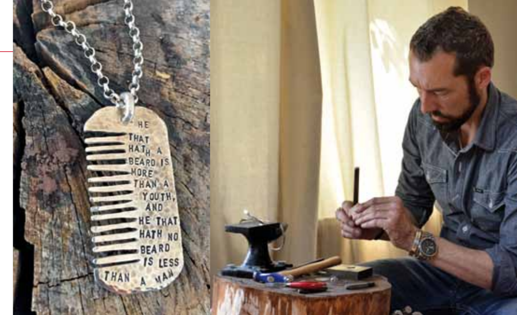
Jedes Schmuckstück von ihm ist ein handgefertigtes Einzelstück, oben ein Bartkamm.

Prominenz wie beispielsweise die Moderatorin und Schauspielerin Désirée Nosbusch, die Schauspielerinnen Ann-Kathrin Kramer und Anouschka Renzi sowie die US-amerikanische Sängerin Lissie. Sie alle tragen ihr individuelles Lebensmotto inzwischen nicht mehr nur in sich, sondern auch an sich – echte Anhänger von „Hard n' Soul“ ;) ■