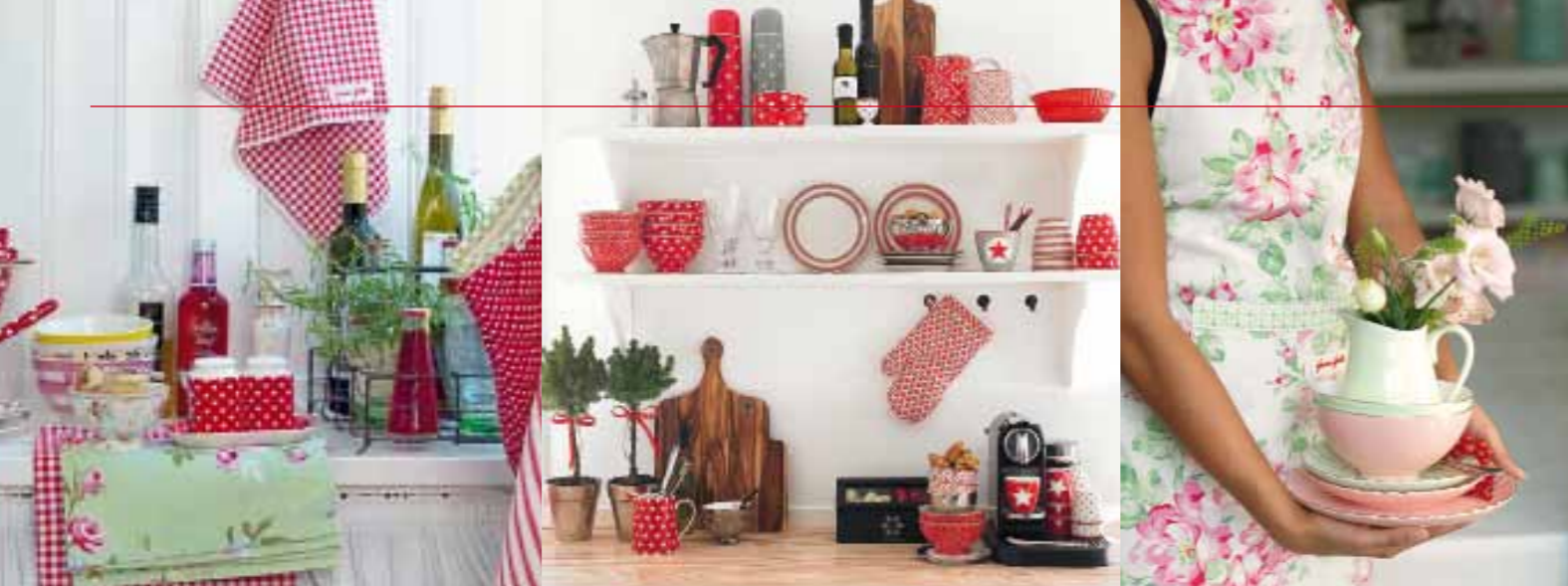
Dinge, die glücklich machen: Dänisches Wohnflair von Rice oder Green Gate