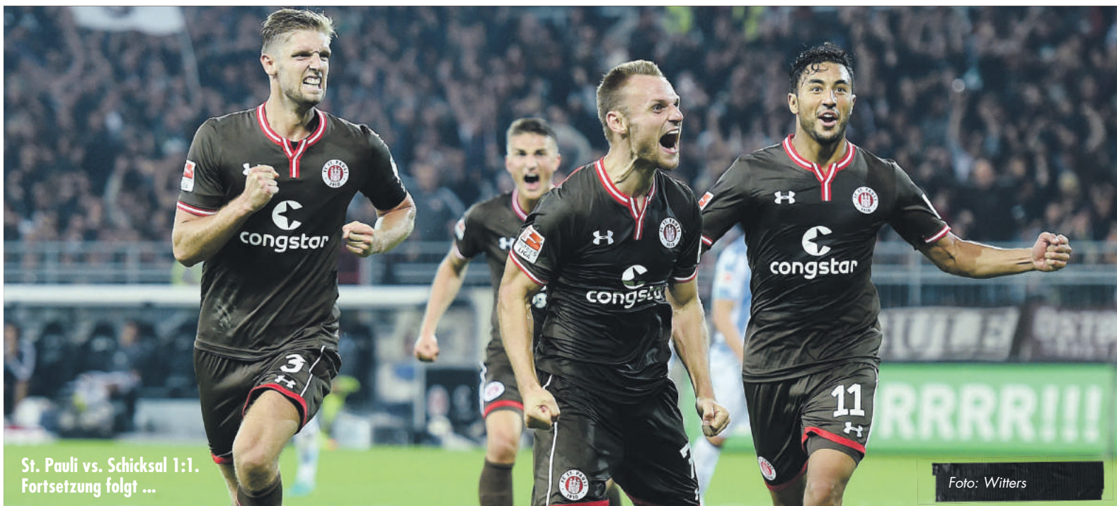
St. Pauli vs. Schicksal 1:1. Fortsetzung folgt ...