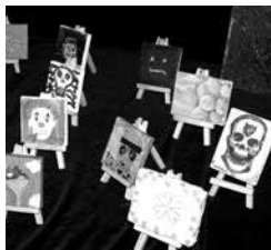
Miniaturen „Glück und Horror“