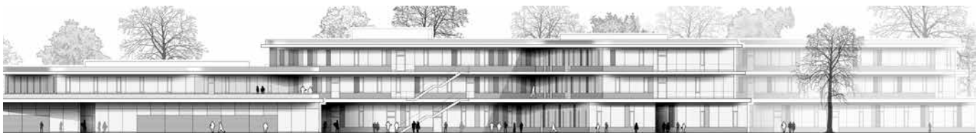
Stadtteilschule Lurup – Ansicht Nord-West, Behnisch Architekten

wortshöh und von der Flurstraße her. Von der Flurstraße wird auch die Zufahrt für Kraftfahrzeuge zu den 18 Parkplätzen und die Zufahrt für die Anlieferung zur Mensa erfolgen.