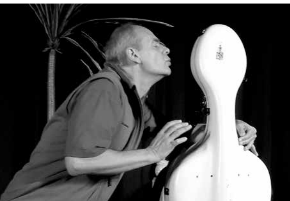
Noch ist die Liebe zum Cello ungestört...