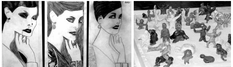
In drei Stufen vom eigenen Gesicht zum Horrortanz