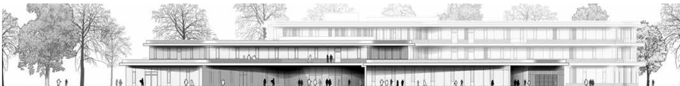
Stadtteilschule Lurup – Ansicht Nord-Ost, Behnisch Architekten

„Wir müssen uns an das Flächenprogramm der Schulbehörde halten,“ sagte Joachim Hinz. „Wir wollen mehr Flächen, aber die Schulbehörde ist nicht bereit, darauf einzugehen.“