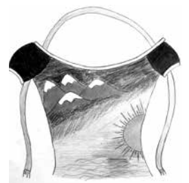
Nachhaltige Mode für das ganze Jahr „Weil man jetzt Sommerkleidung im Winter tragen kann.“