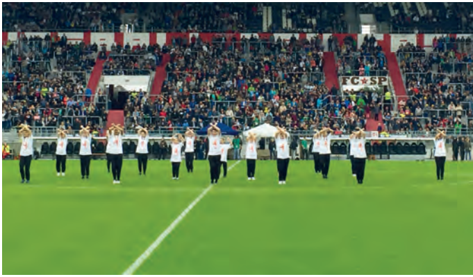
20.000 Zuschauer, 70 Kicker-Legenden und mißendrin die Tänzerinnen und Tänzer des Tanzstudios Step by Step aus Bramfeld. Mit