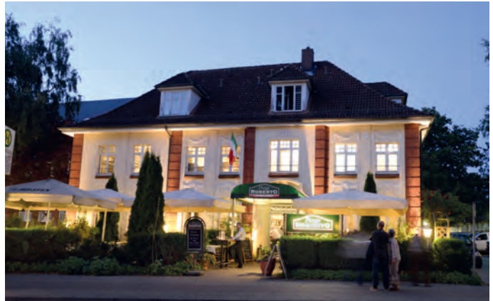
Das tolle Ambiente der Piazza Roberto lädt zum Genießen ein.