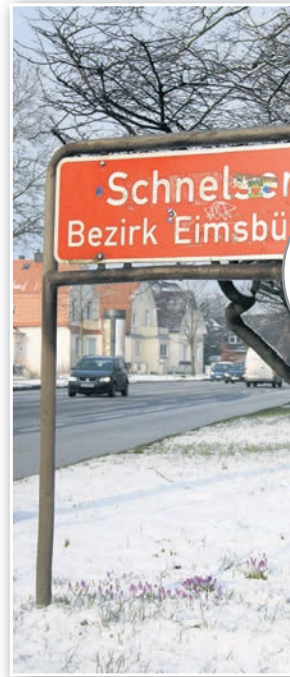
Schnelsen in Zahlen 11 650 Autos sind beispielsweise im Stadtteil gemeldet