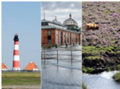
Grafik: Niedersächsisches Ministerium für Umwelt, Energie und Klimaschutz

Klimawandel und Wirtschaft – jetzt die Weichen für T orgen stellen! Die Wirtschaft ist durch vielfältige Weise von den Auswirkungen des Klimawandels betroffen. Welche Risiken und Handlungsmöglichkeiten für die durch direkte Exposition und langfristige Entwicklungszyklen betroffenen Branchen bestehen, greift die 4. Norddeutsche Regionalkonferenz zum Klimawandel auf. Angeboten wird auch ein Workshop speziell für die norddeutsche Wirtschaft.