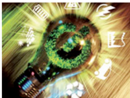
Grafik: Michael Holfelder

Eine große Mehrheit der Hamburger GreenTech-Branche blickt optimistisch in die Zukunft: 73 Prozent der Teilnehmer einer Umfrage der Handelskammer rechnen bis 2020 mit einem Beschäftigungszuwachs in ihrem grünen Geschäftszweig.