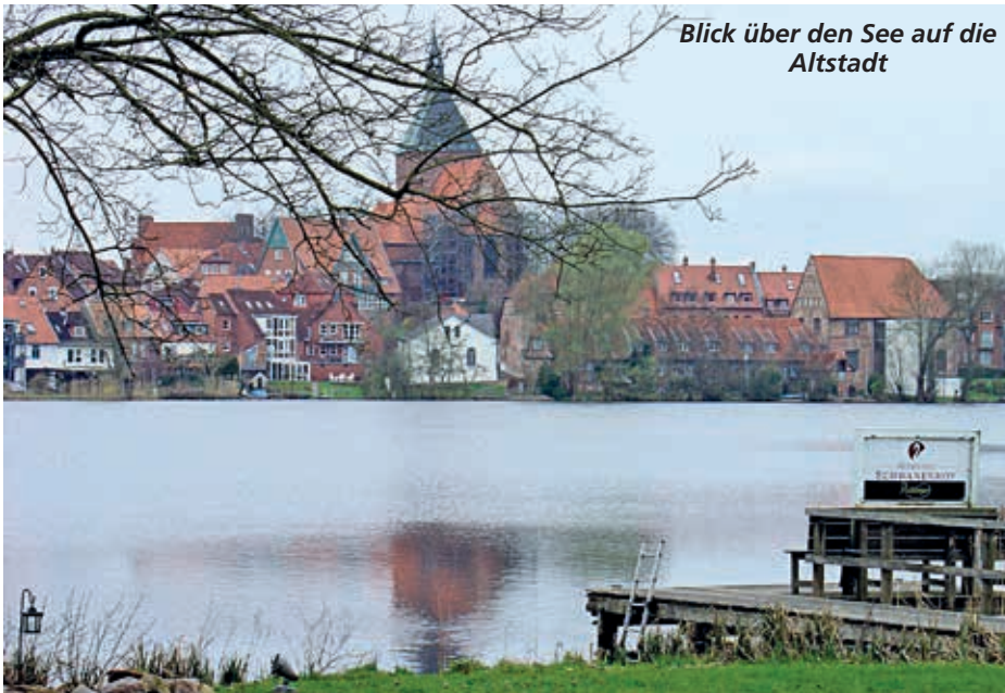
Blick über den See auf die Altstadt

sondern auch den Blick auf den von der Sonne glitzernden Schulsesee.