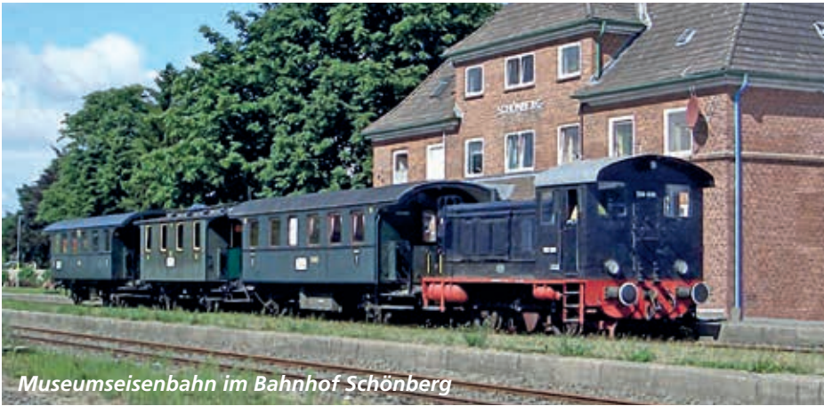
Museumseisenbahn im Bahnhof Schönberg