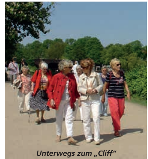
Unterwegs zum „Cliff“