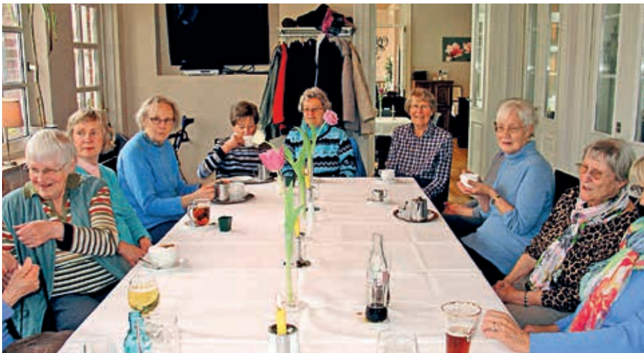
Einkehr im Landhaus Ohlstedt

Da unsere letzte Wanderung an die Außenalster am 3.1.2013 bei Nieselregen und etwas mehr Kälte schon einige Zeit zurücklag, wollten wir (12 Personen) nun unsere Alster im Frühjahr genießen. Das Wetter war prächtig und bei Sonnenschein und Wind spazierten wir vom U-Bahnhof Sierichstraße Richtung Krugkoppelbrücke. In den Straßen Sierich-, Willi-, und Blumenstra-