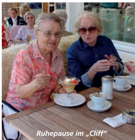
Ruhepause im „Cliff“

hepause. Gestärkt ging es weiter unter der Kennedybrücke durch einen Tunnel Richtung Binnenalster – Neuer Jungfernstieg – Jungfernstieg. Von dort nahmen wir die U-Bahn nach Volksdorf und dankten Petrus für das schöne Wetter! (EL)