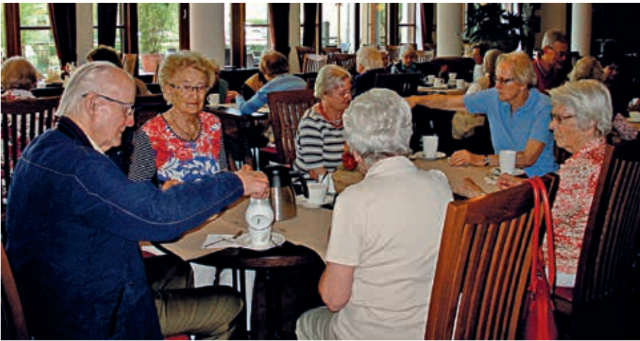
Kaffee und Kuchen im Parkhotel

traumhaften Blick auf Airbus, die Hafenanlagen und die Köhlbrandbrücke sowie die herrschaftlichen Villen.