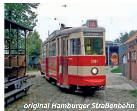
original Hamburger Straßenbahn

Historische Eisenbahnzüge mit Dampf- und Dieselbetrieb sowie uralte Triebwagen fahren von hier aus noch auf einer reizvollen Kleinbahnstrecke; so manches Fahrzeug ist bereits über 100 Jahre alt! Während der Fahrt über das Museumsgebiet – in einer original Hamburger Straßenbahn – erhalten wir wissenswerte Informationen.