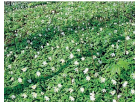
Buschwindröschen in voller Blüte

warmer Raum angeboten. Jeder bestellte etwas nach Wunsch und wir plauderten in freundlicher Runde. Gestärkt und zufrieden machten wir uns gegen 18.00 Uhr auf den Heimweg. (EL/SL)