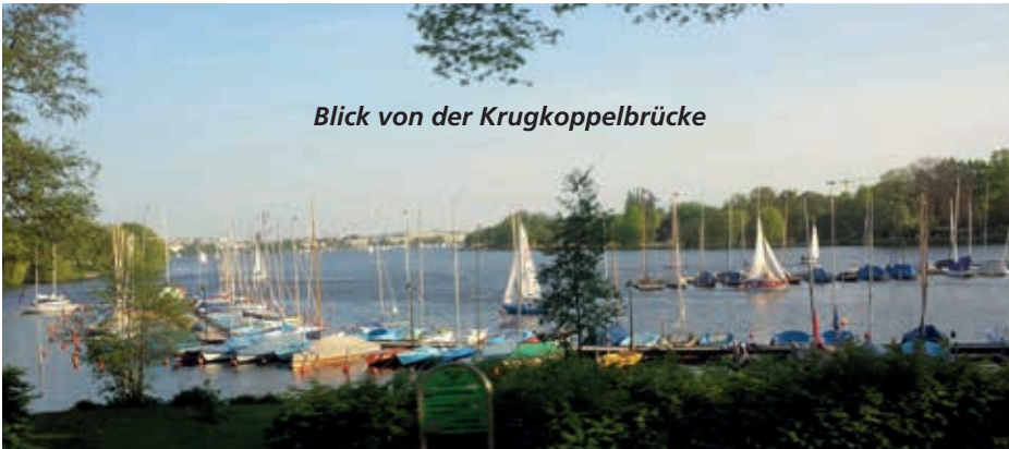
Blick von der Krugkoppelbrücke