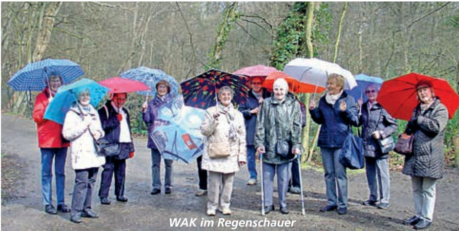
WAK im Regenschauer