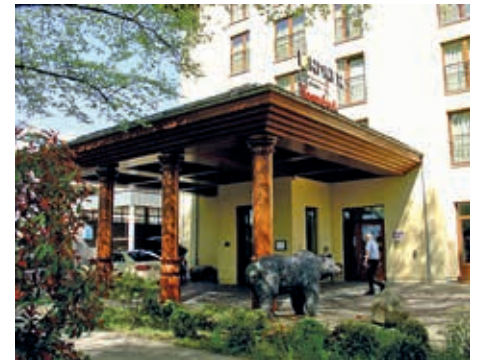
Parkhotel Lindner Hagenbeck

Strahlende Gesichter bei strahlendem Sonnenschein auf der diesjährigen Frühlingsfahrt am 10.05.2016, die uns ab 14.30 Uhr fast einmal quer durch Hamburg führte. Unterschiedlichere Orte konnte man kaum besuchen. Sasel, Poppenbüttel, Ohlsdorf mit der JVA Fuhsbüttel, Eppendorf mit der Automeile Nedderfeld, vorbei am NDR Lokstedt zum Lindner Park Hotel Hagenbeck, wo wir zu Kaffee und Kuchen einkehrten. Was für ein Hotel! Erbaut im kolonial-exotischen Stil. Allein der Fahrstuhl herunter zu den Toiletten ist so edel, dass man hoffte, er möge doch nur für einen Moment steckenbleiben, um diesen Augen- und Anblick länger genießen zu können.