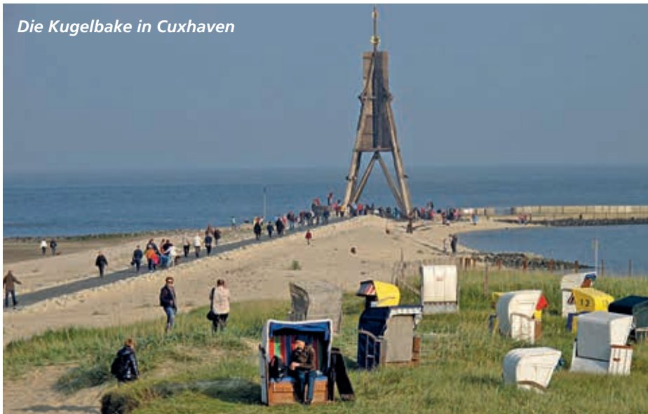
Die Kugelbake in Cuxhaven

Preis: für Mitglieder 49,00 Euro für Gäste 52,00 Euro (SE)