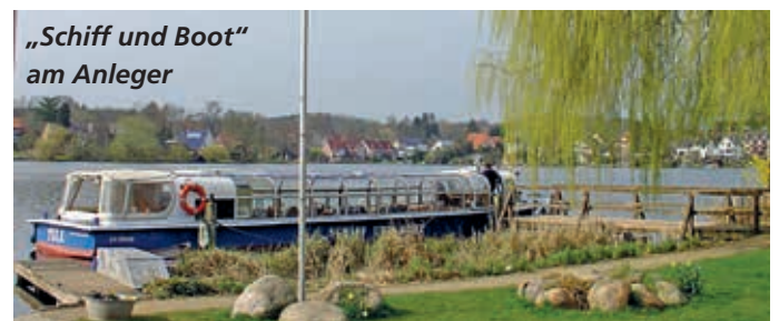
„Schiff und Boot“ am Anleger

Weiter ging's zum Schiffsanleger am Stadtsee, wo eine außerordentlich hilfsbereite und fröhliche Crew allen Teilnehmern aufs kleine Schiff half. Während der Drei-Seen-Fahrt (Ziegel-, Stadt- und Schulse) gab der Kapitän launige Hinweise auf alles Sehenswerte. Dazu wurden Kaffee und Kuchen serviert, wir ließen es uns munden.