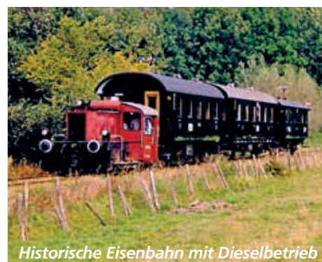
Historische Eisenbahn mit Dieselbetrieb

Angekommen am Schönberger Strand kehren wir zunächst zum Mittagessen ein (s. unten). Danach unternehmen wir eine Reise in die Vergangenheit und besuchen den Museumsbahnhof Schönberger Strand.