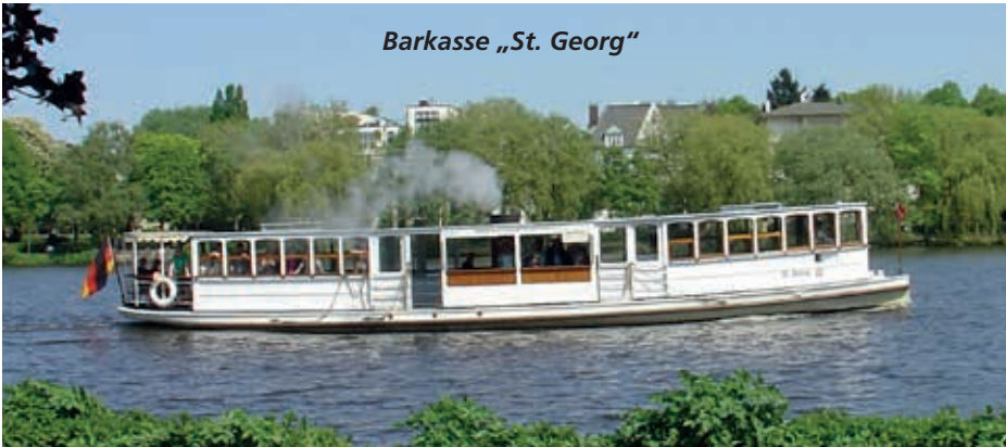
Barkasse „St. Georg“