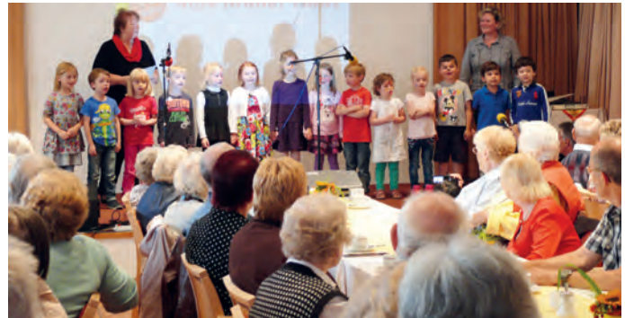
Die Kinder der Kita Hohnerredder erfreuten die Gäste mit einigen toll gesungenen Liedern