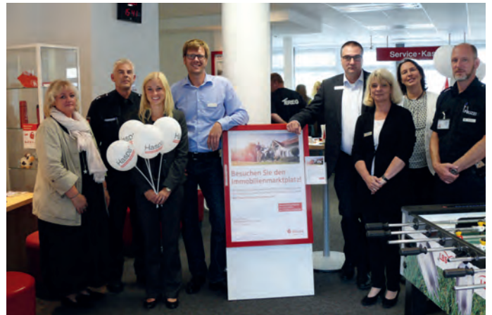
Bei allen Beteiligten war die Freude über die enorme Resonanz groß.

Am 14.07.2016 wurde in der Haspa Filiale Bramfelder Chaussee 248 ein großer Marktplatz zu vielen interessanten Themen rund um die Immobilie in Form von Informationsständen aufgebaut.