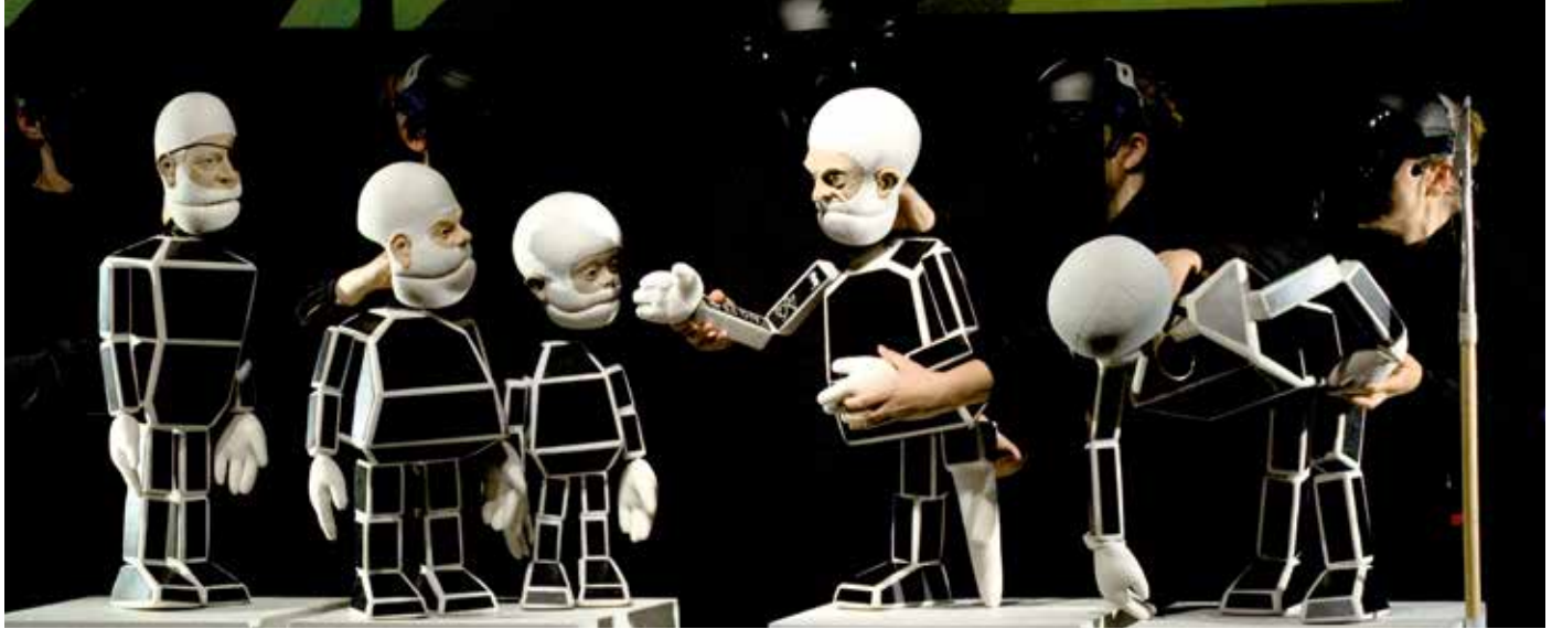
Melville 2.0: Szene aus der multimedialen Hochschulproduktion »Moby Dick«

es gilt auch: Nicht das Medium allein ist verantwortlich für das, was wir daraus machen. Im Übrigen verstelle die öffentliche Diskussion den Blick auf die kreativen Potenziale, die sich selbst in den vermeintlich hermetischen Welten von Computerspielen verbergen.