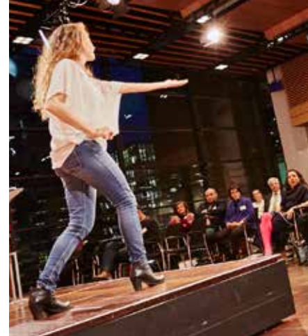
Performance vor Fachpublikum

Letztlich kamen bei dem Symposium aber die teuflischen Details zur Sprache. Lehrer und Vertreter von Schulbehörden konnten auf jahrzehntelange positive Erfahrungen mit Projekten im Musikunterricht verweisen. Dabei hatten ihnen bisher keine Musikvermittler zur Seite gestanden. Man beachte allein den Aufwand und Fahrweg so mancher Schule für einen Besuch der Elbphilharmonie. Für Schulen in Zeiten von G8 und Ganztags sind Projekte mit außerschulischen Partnern eine große Herausforderung. Mit Einfüh-