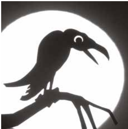
»Krabat« vom Theater Papillon

weise durch eigenen Figuren- und Bühnenbau realisiert und oft durch Musik angereichert. Im Repertoire finden sich Themen für unterschiedliche Altersstufen zwischen drei und zehn Jahren, darunter auch sogenannte Präventionsstücke zu gesunder Ernährung und sexualisierter Gewalt. Förderung gab es eher selten, die Mischung aus Schauspiel und Figurentheater finanziert sich in erster Linie aus Gagen. Des Holzwurms Credo: »Eine dichte Atmosphäre und Herzblut bei allem, was wir machen.«