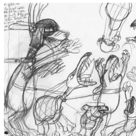
Sven Nordqvists Bilderwelten

zulande nur als Vater von »Pettersson und Findus« bekannt ist. »Eine Bilderreise« gewährt die Sicht auf ein stilistisch vielfältiges und reiches Gesamtwerk und auch Einblicke in die Skizzen-Werkstatt. Das 320-seitige Buch kostet 19,99 Euro.