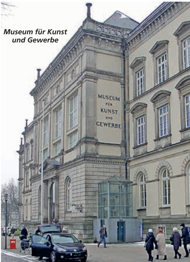
Museum für Kunst und Gewerbe

Louis-Seize-Raum, den Spiegelsaal und historische Tasteninstrumente aus der Sammlung Beurmann (EG). Im Zwischengeschoss kann man die Ausstellung zu Fayence und Porzellan bewundern. Im 1. OG sieht man die Sammlungen Moderne, Jugendstil, Islam, Buddhismus und Samurai, das Japanische Teehaus und historische Tasteninstrumente. Hier befindet sich auch das Restaurant-Café Destille. Das 2. OG beinhaltet die Sammlungen Ostasien, Design nach 1945 mit der legendären SPIEGEL-Kantine, Moderne Hamburg und die HASPA-Galerie.