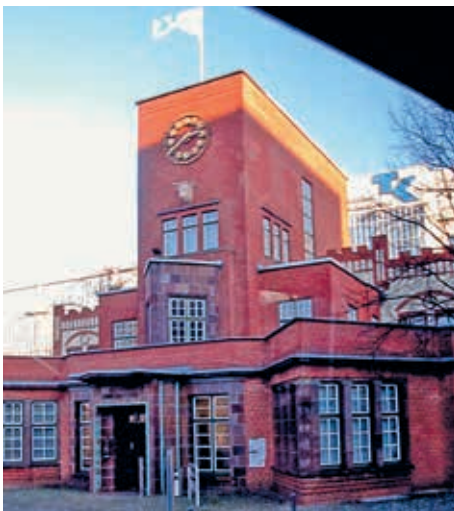
Eingangportal ehem. Margarine Voss

portal bewundern. Unser Weg führte uns am umgebauten AK Barmbek vorbei mit dem Wasserturmpalais Restaurant Q21. Das letzte Bauwerk von Schumacher in Hamburg ist das Krematorium im Ohlsdorfer Friedhof, haben wir erfahren. Überrascht hat uns, dass der Hamburger Flughafen der älteste in Deutschland ist und im Jahr seiner Gründung 1920 nur 241 Passagiere hatte und heute über 14 Mio. Am Eppendorfer Moor vorbei ging es zur Baustelle Autobahndeckel A 7. Der Kaffee wartete in der Kaffeerösterei in