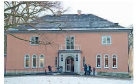
Treffpunkt für Genießer: Die Ohlendorff'sche Villa

Karten gibt es nur im Vorverkauf im Wiener Kaffeehaus in der Ohlendorff'schen Villa. Ein schöner Abend erwartet Sie!