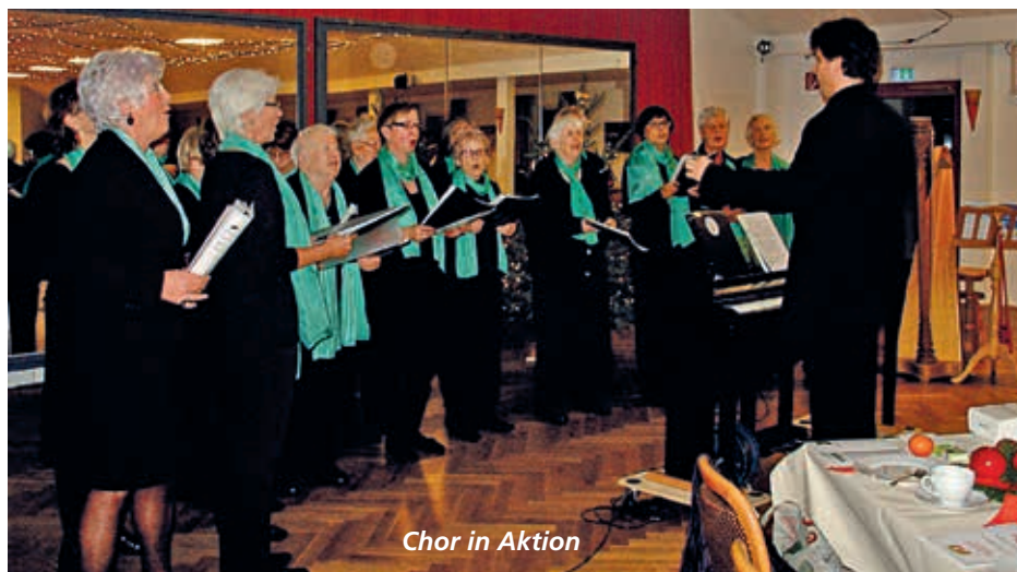
Chor in Aktion