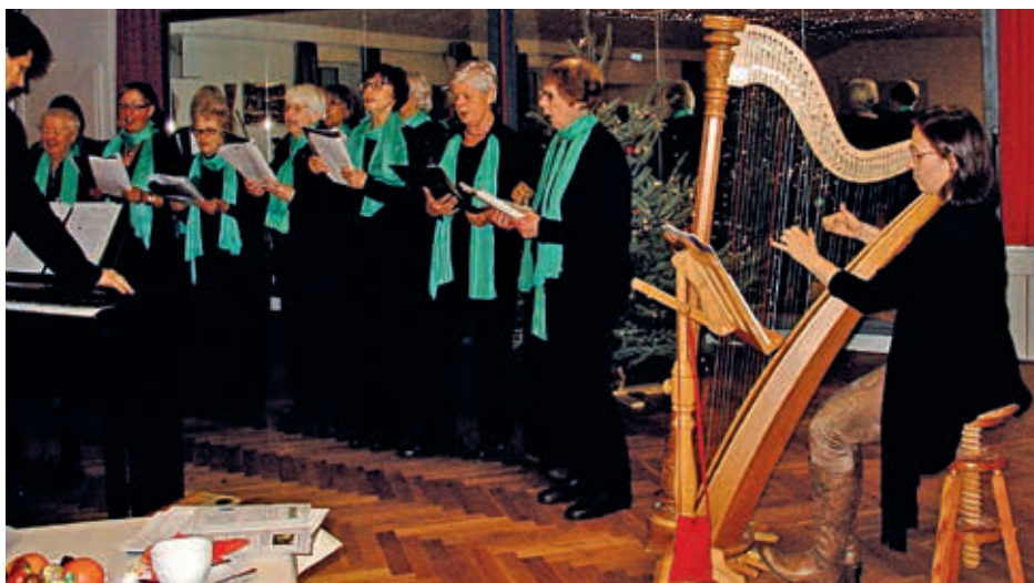
Chor und Harfe