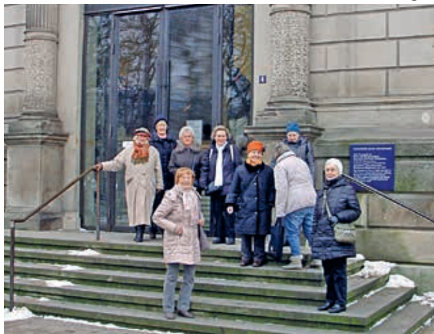
WAK vor dem Eingang zum Museum

Winterwetter ist Museums-wetter, daher fuhren 10 Personen unserer Gruppe mit der U-Bahn bis Hauptbahnhof und gingen nur einige Schritte zum MK&G. Es besteht aus 4 Geschossen, vom UG bis 2.OG. In jeder Etage befinden sich Dauerausstellungen interessanter Sammlungen, wie Antike und Renaissance, Christentum, Judentum, die Milde-Speckter-Zimmer, den