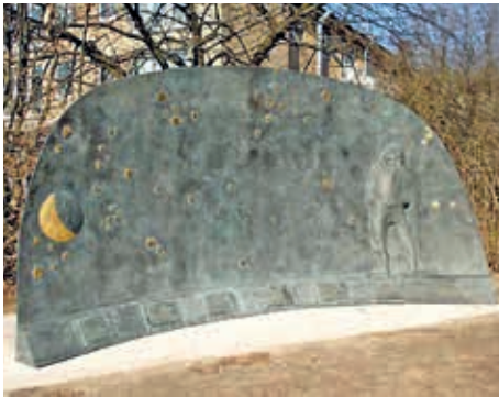
Relief „Der Mond ist aufgegangen“

Mit einem vollbesetzten Hamburg Bus ging es Richtung Wandsbek an der Nestlé Schokoladenfabrik vorbei. Wir sahen das Bovehaus, eine ehemalige Kaufmannsvilla. Besonders schön im Sonnenlicht war das Relief von „Der Mond ist aufgegangen“ von Matthias Claudius, erstellt vom Bildhauer Waldemar Otto aus Worpsswede. Weiter ging es an der ehemaligen Margarinefabrik Voss vorbei, wo sich seit 1981 die Techniker Krankenkasse befindet. Wir konnten den Rinderkopf am Eingangs-