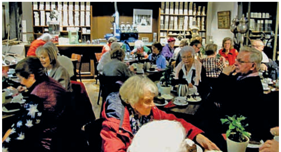
In der Kaffeerösterei