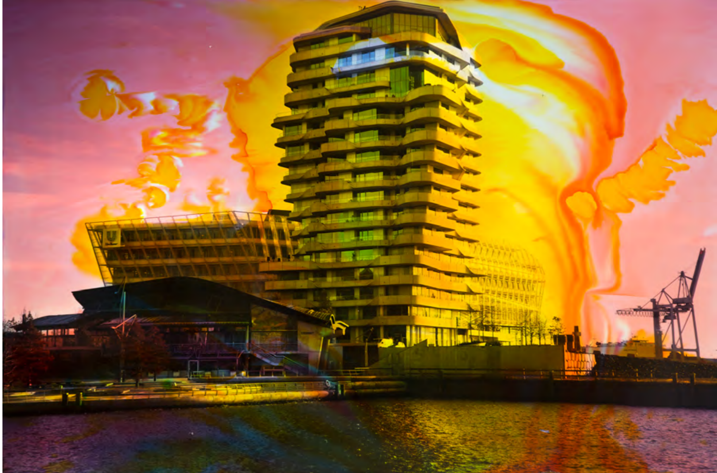
Hamburg A 4 2016, Malerei und Siebdruck auf Fotografie, 60 x 90 x 6 cm