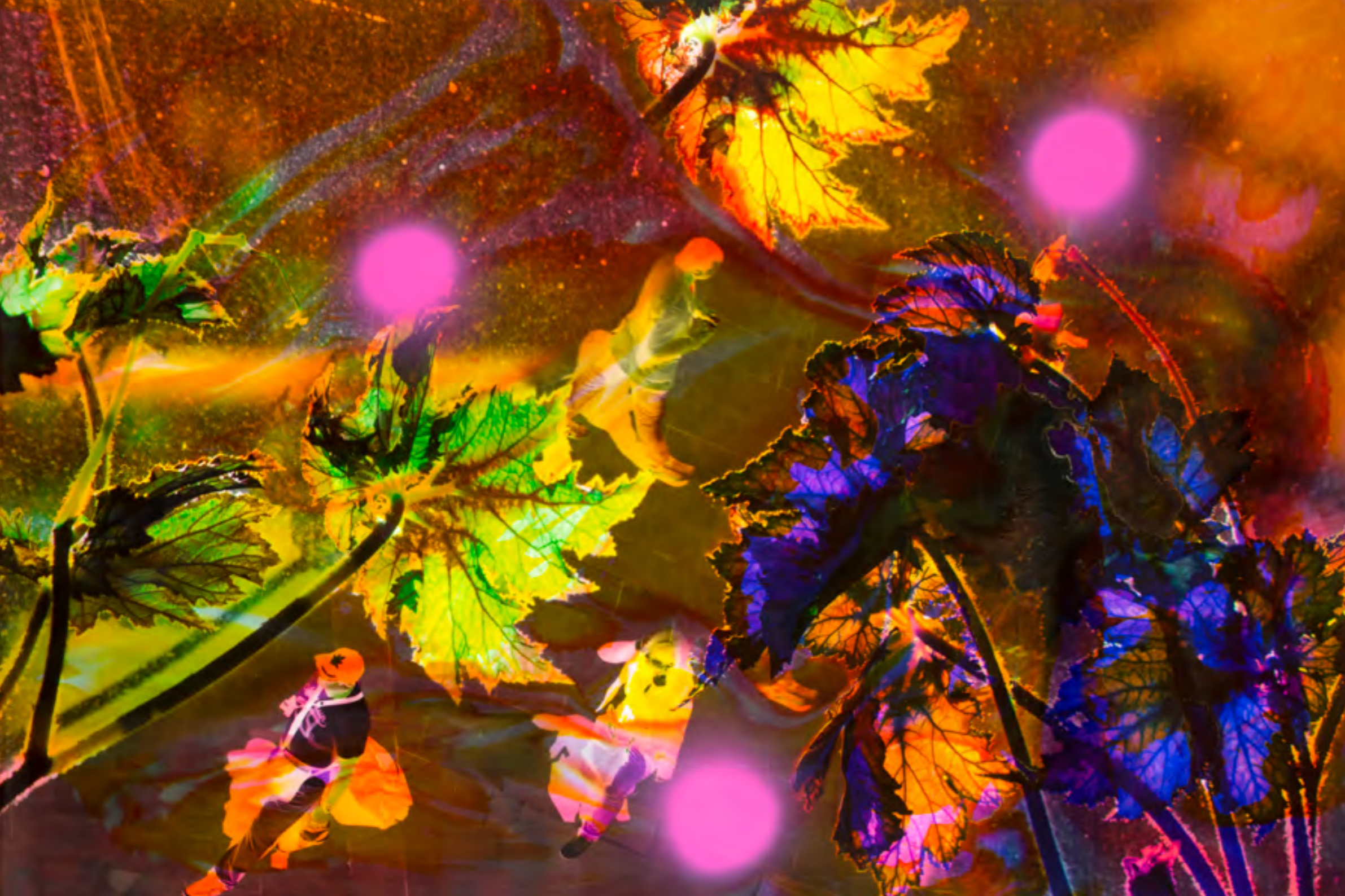
Dreams of Nowhere 2 2015, Malerei und Siebdruck auf Fotografie, 80 x 120 x 6 cm London A 9 2016, Malerei und Siebdruck auf Fotografie, 80 x 180 x 6 cm