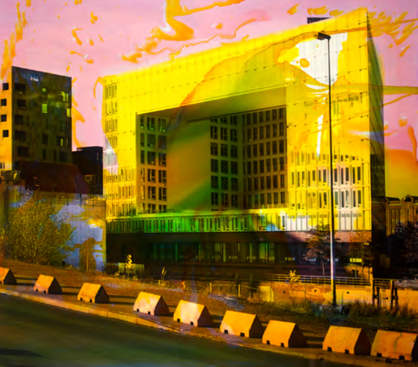
Hamburg A 3 2016, Malerei und Siebdruck auf Fotografie, 110 x 125 x 6 cm Hamburg A 1 2016, Malerei und Siebdruck auf Fotografie, 180 x 100 x 6 cm