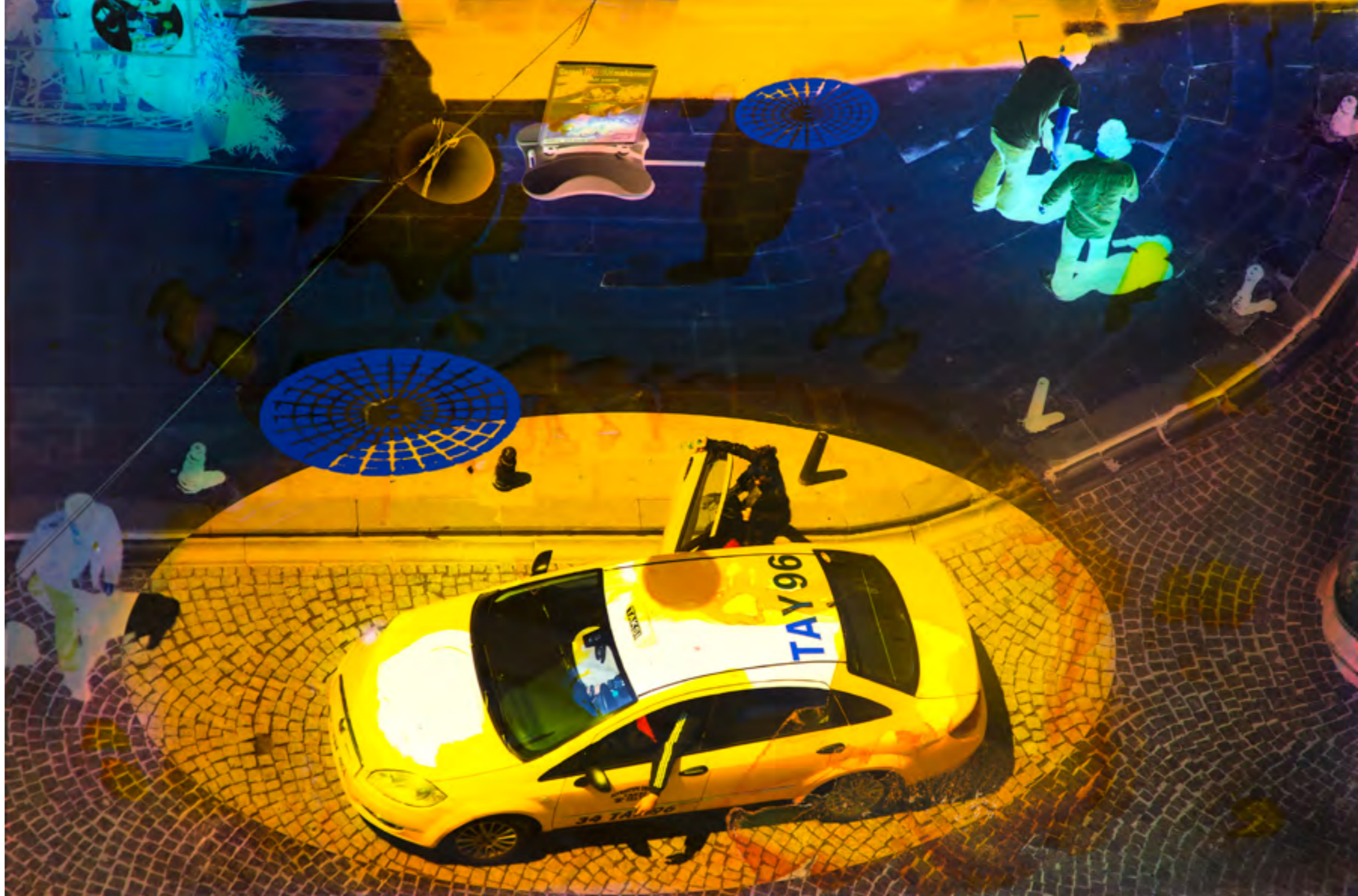
Taksi 4 2014, Malerei und Siebdruck auf Fotografie, 60 x 90 x 6 cm