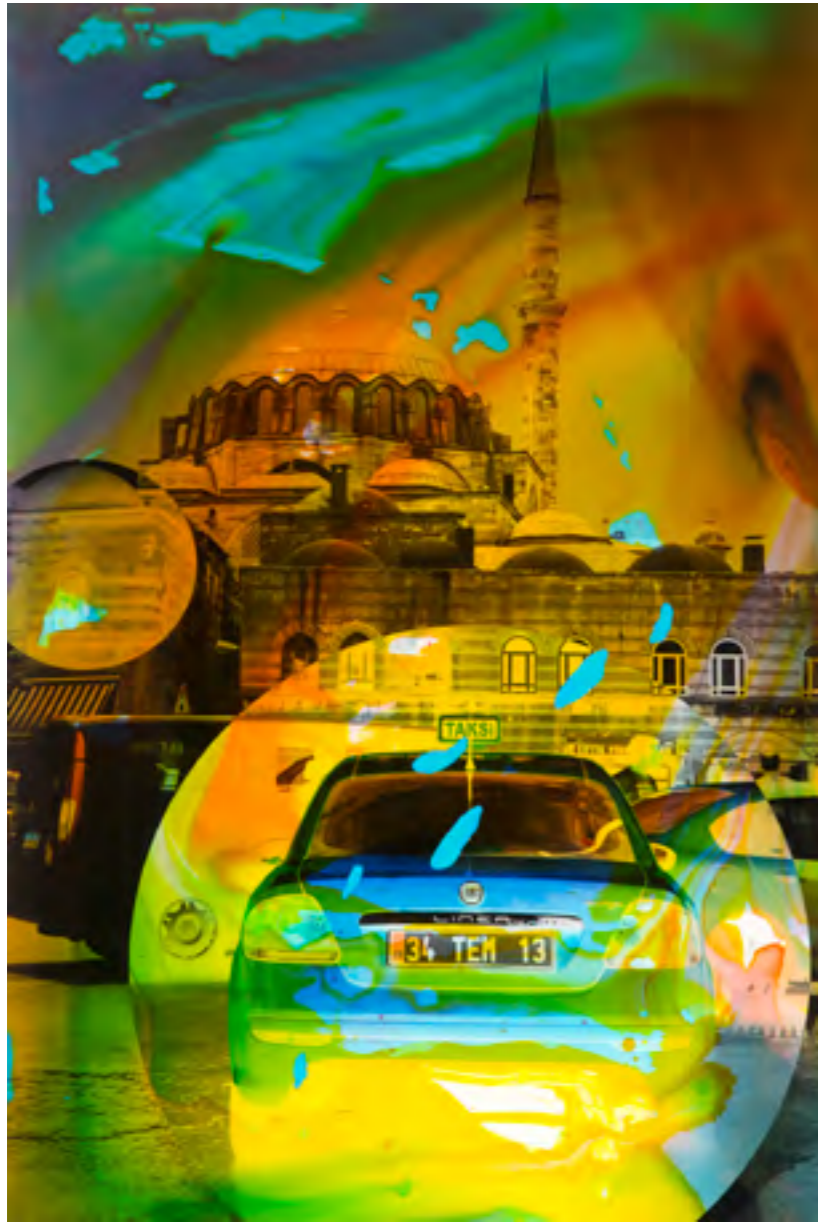
Istanbul D 2 2015, Malerei und Siebdruck auf Fotografie, 90 x 60 x 6 cm Istanbul A 3 2014, Malerei und Siebdruck auf Fotografie, 150 x 80 x 5 cm