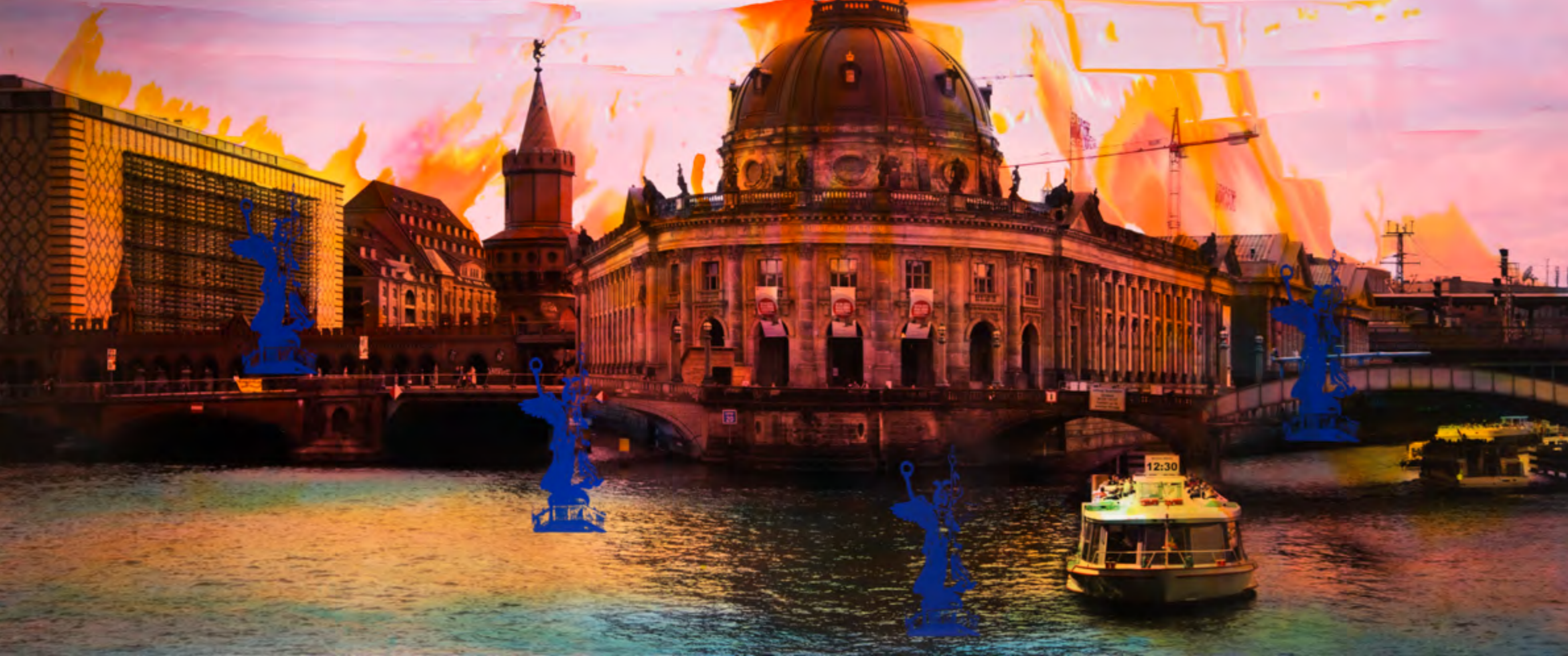
Berlin A 1 2016, Malerei auf Schwarzweißfotografie, 100 x 240 x 6 cm