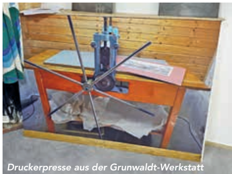
Druckerpresse aus der Grunwaldt-Werkstatt

In Anwesenheit von ca. 100 Gästen wurde im Stadtteilmuseum der zweite Arbeitsplatz