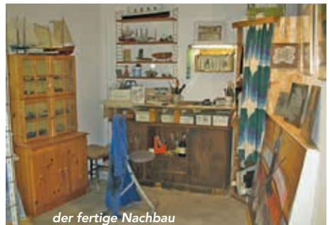
der fertige Nachbau