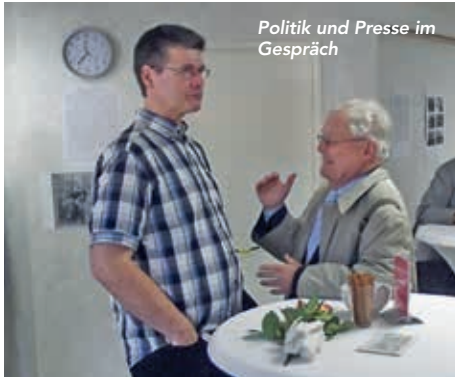
Politik und Presse im Gespräch