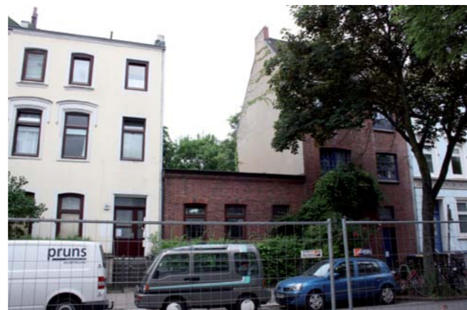
Das durch Kriegsschaden bedingte eingeschossige Gebäude Annenstraße 26 soll wieder aufgestockt werden.