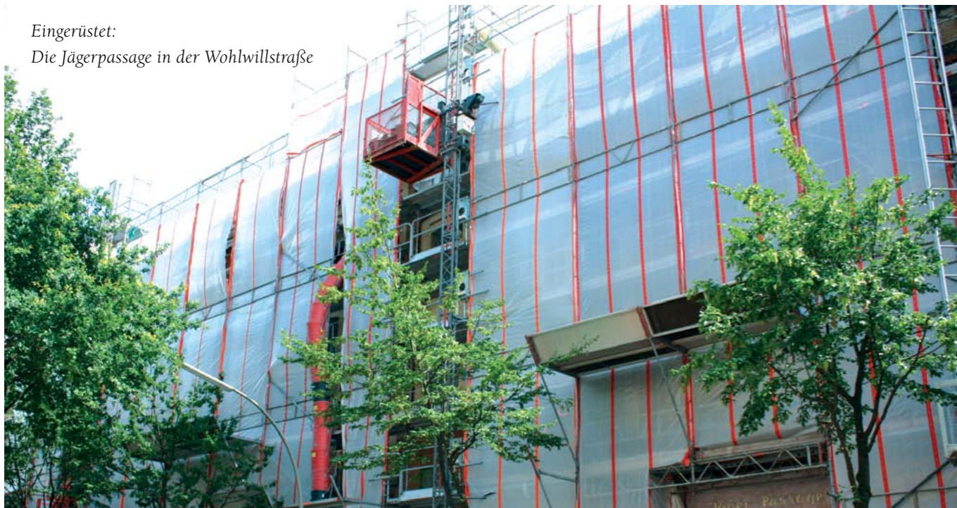
Eingerüstet: Die Jägerpassage in der Wohlwillstraße

Mit Ende des Sanierungsverfahrens voraussichtlich in 2016 werden auch die letzten öffentlich geförderten Baumaßnahmen im Sanierungsgebiet St. Pauli Wohlwillstraße abgeschlossen.