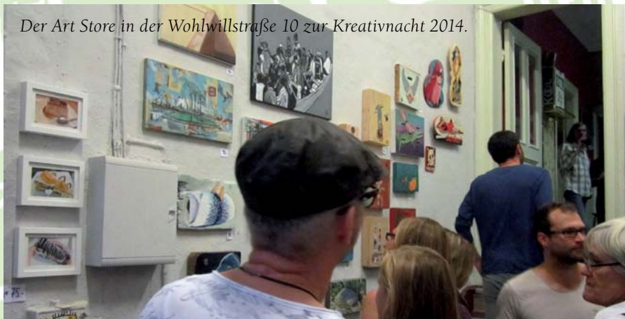
Der Art Store in der Wohlwillstraße 10 zur Kreativnacht 2014.

Amt für Wohnen, Stadterneuerung und Bodenordnung, Neuenfelder Str. 19 Modernisierung: Frau Garbers, Tel. 42840-8436.