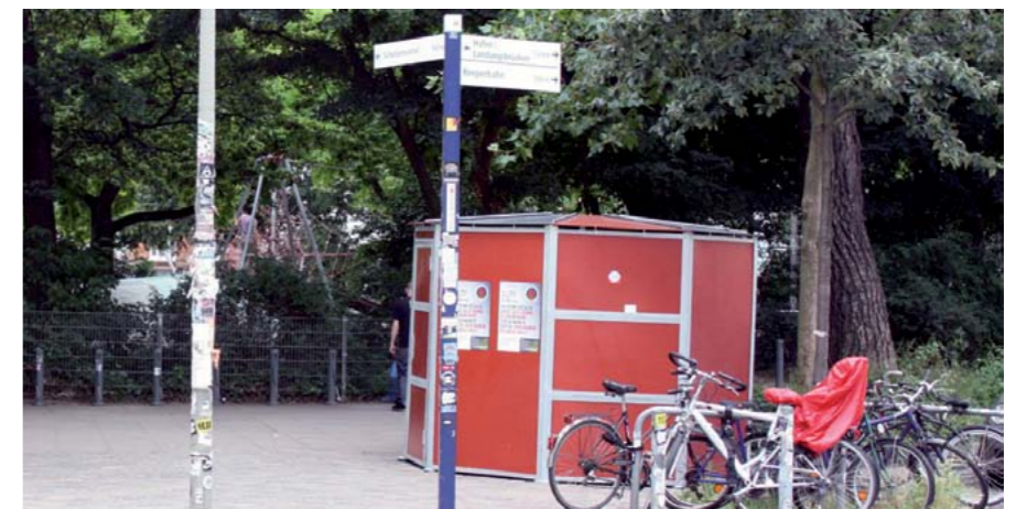
Das neue Fahrradhäuschen am Paulinenplatz schräg gegenüber der Apotheke.