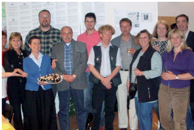
Zur 100. Beiratssitzung gab es Torte.