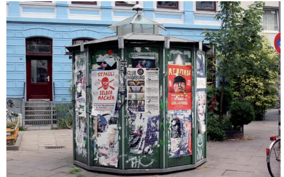
Dieses Fahrradhäuschen Modell wird nicht mehr hergestellt.