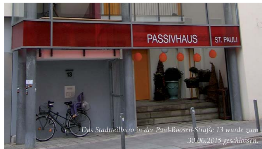
Das Stadtteilbüro in der Paul-Roosen-Straße 13 wurde zum 30.06.2015 geschlossen.