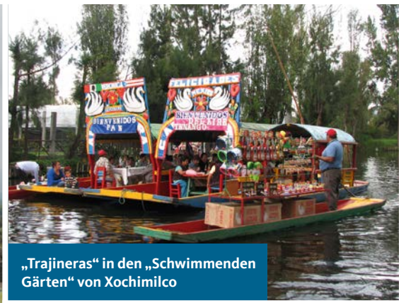
„Trajineras“ in den „Schwimmenden Gärten“ von Xochimilco