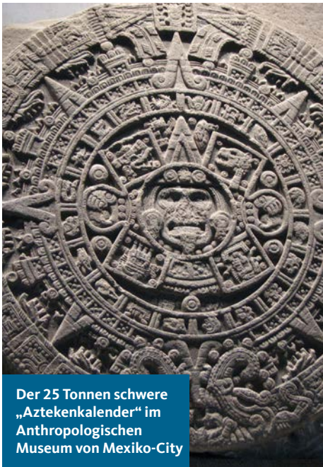
Der 25 Tonnen schwere „Aztekenkalender“ im Anthropologischen Museum von Mexiko-City