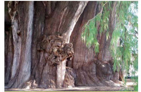
Der Baum von Tule mit einem Stammumfang von 58 Metern

der Pyramiden waren beachtlich. Trotzdem ist der Aufstieg einfach, im Vergleich zum Abstieg. Die Busfahrt von der Pazifikebene hinauf in die zerklüftete Berglandschaft war atemberaubend schön. Zwischendurch gab es immer wieder ein paar Fotostopps, damit wir die Berglandschaften, die Kakteenwälder, die „Schwiegermutter-Stühle“, Elefantenfuß-Bäume und gelb blühenden Agaven fotografieren konnten. Aus Platzgründen mussten wir diesen Bericht leider sehr kurz fassen. Wir hätten Ihnen noch gerne von den Ausflügen zu den Mangroven erzählt, von der Mezcal-Brennerei, von den imposanten Wasserfällen Agua Azul, vom Regenwald,