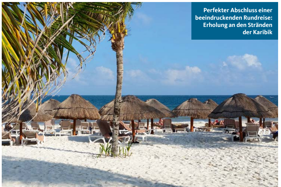
Perfekter Abschluss einer beeindruckenden Rundreise: Erholung an den Stränden der Karibik

von der Ausgrabungsstätte Mitla, vom Besuch des Indianermarkts in dem maleisischen Städtchen San Cristóbal, vom Schloß Chapultepec, von der antiken Stadt Tehuantepec, von der Maya-Ruinenstadt Uxmal, von den Städten Palenque und Campeche, von der Bootsfahrt durch den Canyon mit seinen steilen Bergwänden und den Krokodilen, den Geiern und den Kormoranen und, und, und... Wir hoffen, dass wir Ihnen einen kleinen Einblick in das faszinierende Land Mexiko geben konnten.