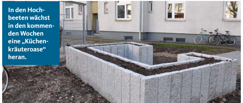
In den Hochbeeten wächst in den kommenden Wochen eine „Küchenkräuteroase“ heran.

Rechtzeitig zum Frühjahr können die Mitglieder des Wohnquartiers nicht nur die neuen Sitzgruppen und die bequemen Ruheliegen nutzen. Auch frische Kräuter aus eigenem Anbau können bald von allen Bewohnern geerntet werden. Im Zuge der Neugestaltung des Innenhofes wünschten sich die Mitglieder Pflanzbeete, um beispielsweise Küchenkräuter ziehen zu können. Der BAUVEREIN hat den Vorschlag aufgenommen und zwei Hochbeete gebaut, die sich rückschonend bearbeiten lassen und in denen Gemüse und Kräuter dank vieler Nährstoffe und zusätzlicher Bodenwärme optimal gedeihen. Am 9. April trafen sich interessierte Mitglieder direkt an den Hochbeeten und schilderten Ines Wessel-Schmidt und Andreas Bredehöft vom Team des BAUVEREINS ihre Ideen für die Erstbepflanzung. Die Garten- und Landschaftsbau Hohenberg GmbH wird im Auftrag des BAUVEREINS die Vorschläge umsetzen und eine „Küchenkräuteroase“ mit Schnittlauch, Basilikum, Petersilie, Salbei und vielen weiteren Kräutern anpflanzen. Für die weitere Pflege und Bepflanzung übernehmen bereits jetzt die Mitglieder die Zuständigkeit.