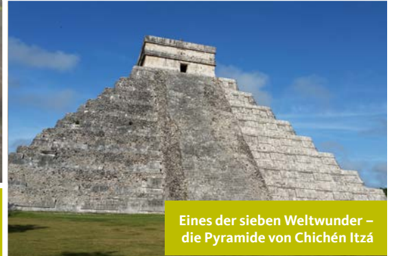
Eines der sieben Weltwunder – die Pyramide von Chichén Itzá

Wer alles sehen will, sollte früh aufstehen! Eine Rundreise ist nichts für Langschläfer: Um 6.00 Uhr klingelt der Wecker, um 7.00 Uhr gibt es Frühstück und um 8.00 Uhr geht es spätestens los. Unsere Reisegruppe bestand aus 15 Personen und einem super Reiseleiter, der jede Frage bis ins Detail beantworten konnte. Unsere 15-tägige Rundreise begann direkt in Mexiko-City mit einer ausführlichen Stadtrundfahrt. Zu Fuß ging es dann durch das historische Stadtzentrum mit seinen imposanten Gebäuden, über den Zócalo – einen der größten Plätze der Welt. Der Regierungspalast war aus Sicherheitsgründen für Besucher geschlossen. Wir haben die beeindruckende Kathedrale besichtigt. Glanzpunkt im Innern ist ein ganz aus Blattgold überzogener Altar. Hier kopierten die Bauherren eine Verfahrenstechnik der indianischen Ureinwohner. So benutzten sie zum Beispiel den roten Farbstoff einer Laus.