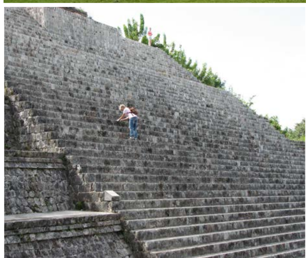
Roswitha Franke beim Pyramidenklettern