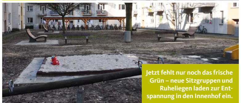
Jetzt fehlt nur noch das frische Grün – neue Sitzgruppen und Ruheliegen laden zur Entspannung in den Innenhof ein.