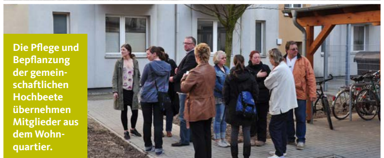
Die Pflege und Bepflanzung der gemeinschaftlichen Hochbeete übernehmen Mitglieder aus dem Wohnquartier.