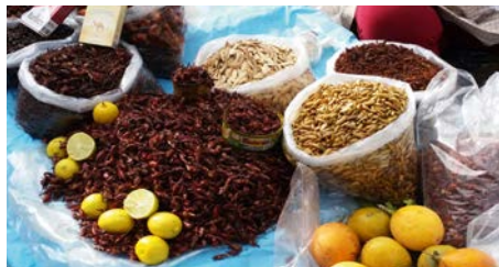
Heuschrecken gekocht und geröstet – „Chapulines“ auf dem Wochenmarkt in Oaxaca

wunderschönen Opernhaus angesehen. Und ob Sie es glauben oder nicht: Später sind wir dann sorglos durch die Straßen von Mexiko-City gezogen. Wir haben uns genauso sicher gefühlt, wie in fast jeder anderen Großstadt auch. Vielleicht lag es an der Polizeipräsenz, die in der Stadt ziemlich groß war.