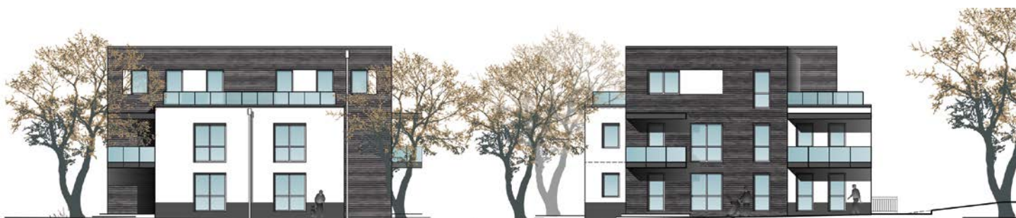
Die Sonnenseiten des Neubauprojektes mit großen Balkonen und Terrassen – Ansichten von Westen und Süden