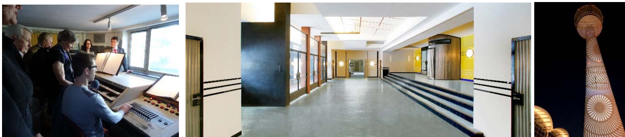
Vorführung der Wasserlichtorgel, Künstlerhaus Sootbörn, Illumination Fernsehturm