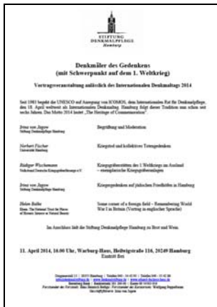
Vortragsveranstaltung anlässlich des Internationalen Denkmaltags

Die Stiftung veranstaltet den Internationalen Denkmaltag, der seit 1983 auf Anregung von ICOMOS von der Unesco für den 18. April weltweit begangen wird. Aus diesem Anlass lud die Stiftung Denkmalpflege bereits am 11. April zu einer Vortragsveranstaltung ins Warburg-Haus, die unter dem Jahresmotto der Unesco „Denkmäler des Gedenkens (mit Schwerpunkt auf dem 1. Weltkrieg)“ stattfand. Die Veranstaltung mit fünf Vorträgen, unter anderem einem Vortrag einer ehemaligen Mitarbeiterin des National Trust, war gut besucht.