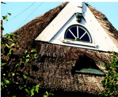
Altengammer Elbdeich 76 vor der Erneuerung des Firstes

Die Stiftung fördert die Reeteindeckung und Reetfirsterneuerung an Haus Nr. 76 sowie die Teilfirsterneuerung an Haus Nr. 70.