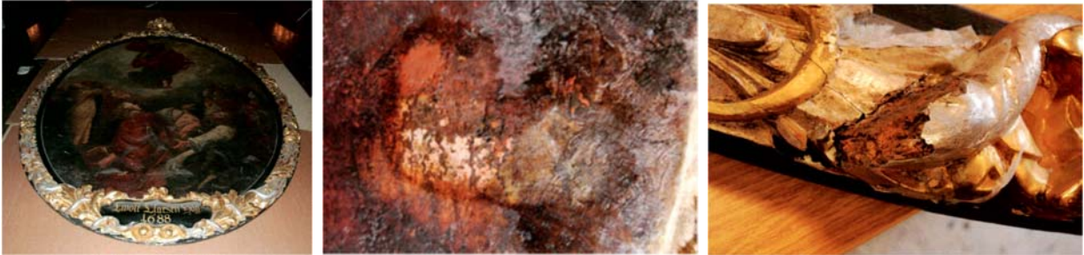
„Christi Himmelfahrt“ (1888, Joachim Luhe zugeschr.), Schadensbild Malschicht und Zierwerk; Fotos: Ruth Hauer

Die Restaurierung zweier Gemälde (Joachim Luhe zugeschrieben) im Kirchenschiff der Hauptkirche St. Jacobi wird gefördert.