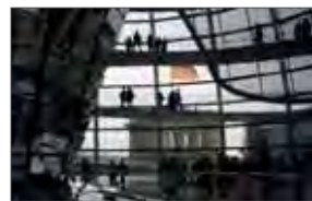
In der Kuppel des Reichstagsgebäudes

An einen Bundestagsabgeordneten des eigenen Wahlkreises wenden und Kontakt aufnehmen, um eine Besuchsreise zum Bundestag zu unternehmen. Das Bundespresseamt unterstützt diese Unternehmung organisatorisch und finanziell. Einen Termin für ein Fachgespräch mit einem Politiker bekommt man allerdings nicht garantiert.