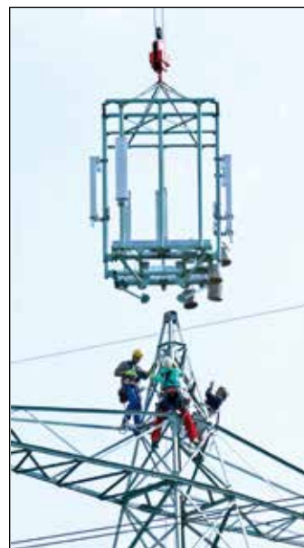
Antenne im Anflug

lekom sieht den Ausbau der Netze GSM, UMTS und LTE 1800 vor. Der Vorteil der Nutzung von Strommasten liegt in deren Höhe, was eine große Reichweite verspricht, und der Nutzung vorhandener Infrastruktur. Die Arbeiten wurden von der Firma EQOS, die über entsprechende Erfahrungen verfügt, problemlos abgeschlossen. Das Ergebnis sieht aber irgendwie komisch aus. Der Anblick eines Antennenkäfigs auf einem Strommast ist gewöhnungsbedürftig. ltw