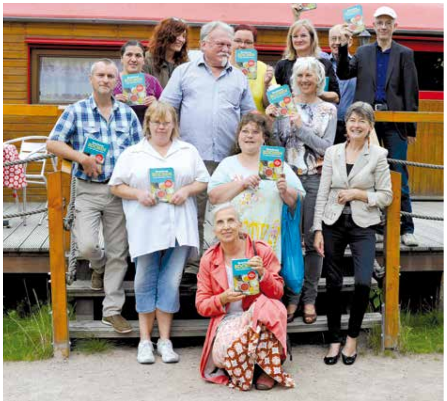
KöchInnen, Kursleiterinnen und „Bildung für alle!“ stellen das Kochbuch vor.