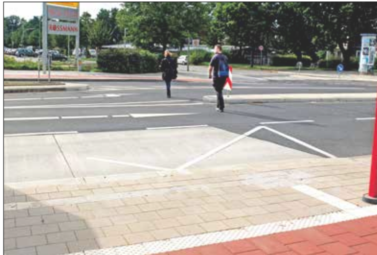
Vom Bus zum Borncenter geht es über vier Fahrspuren

(Nord) wird der Gehweg zu eng; wartende Fahrgäste stehen auf dem Radweg.