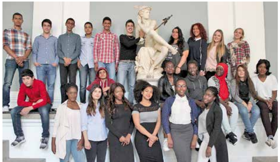
Die jungen UnternehmerInnen

Futurepreneur und die Kooperationspartner Haus der Jugend Osdorfer Born und Stadtteilschule Wilhelmsburg ermöglichten die beiden Ferienprogramme mit der finanziel-