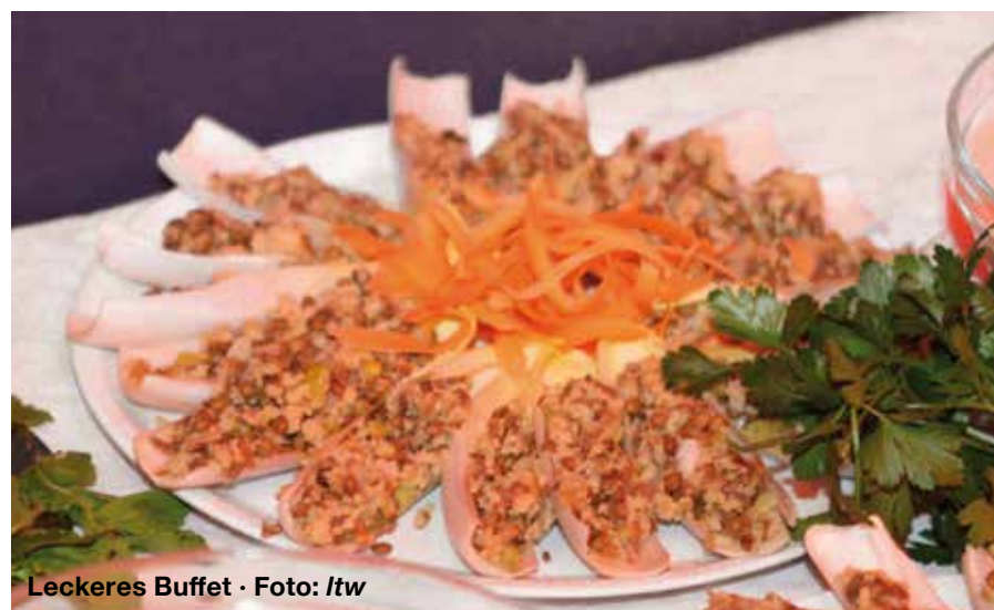
Leckeres Buffet

planung des Bezirksamts Altona. Ermöglicht wurde das Projekt durch viel ehrenamtliches Engagement sowie durch die finanzielle Unterstützung der SAGA GWG Stiftung Nachbarschaft und des Hamburger Spendenparlaments.