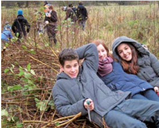
Wohlverdiente Atempause

Bereits im zweiten Jahr in Folge unterstützte eine Klasse des Lise-Meitner-Gymnasiums den NABU bei Naturschutzarbeiten in der Feldmark (s. Titelbild). Eine Schü-