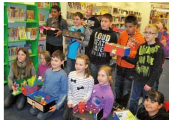
Stolze Leseratten bei den Borner Lesetagen