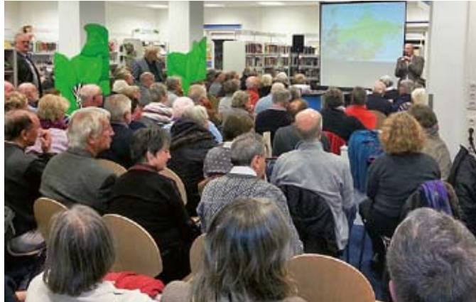
Bildervortrag für Fahrrad-Enthusiasten

Klassenführungen, Kita-Veranstaltungen, Dialoge in Deutsch, Bastelnachmittage, Ferienprogramme, Märchentage usw. Erfolgreich gestartet wurden aber auch neue Projekte: Seit März treffen sich jeden Donnerstag um 10 Uhr Frauen im neuen Strick-Club zum munteren Stricken, Klönen und Kaffeetrinken. An jedem zweiten Freitag im Monat können rätselbegeisterte Kinder zwischen 7 und 12 Jahren beim „Rätselspaß“ tolle Preise gewinnen. Eine „Gedichte-für-Wichte-Gruppe“ für Mütter mit Kindern bis zu 3 Jahren fand leider wenig Anklang; vielleicht gibt es später einmal einen Neustart. Besonders aufregend war für das Bücherhallenteam der halbjährige „Bücherhallenkurs“ der Ganztagschule Barlsheide. Ein-