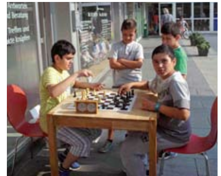
Freude beim Schach im BornCenter

Die TeilnehmerInnen der Schachgruppen trafen sich 2012 einmal monatlich von 17.30 – 18.30 Uhr jeweils bei der Alsterdorf-Assistenz-West im BornCenter sowie im Stadtteilhaus Lurup Böverstand. Ab März 2013 soll es weitergehen; die Termine werden in Kürze bekanntgegeben. Wer interessiert ist, kann einfach ohne Anmeldung dazukommen. Künftig sind Kurse auch im neuen Bürgerhaus Born-