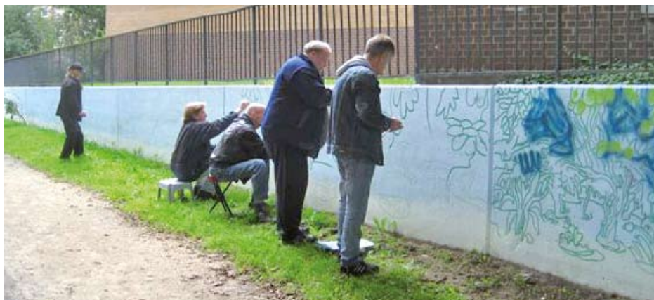
Gemeinsam geht's besser.

Wer mehr über die Arbeit des Projekts Walldesign zur beruflichen Integration von arbeitssuchenden Jugendlichen und Erwachsenen erfahren möchte, kann sich darüber bei YouTube unter „KOM-hier wird geholfen“ informieren. gs