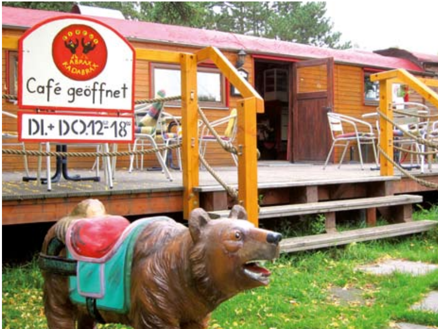
Dieser Bär beißt nicht...