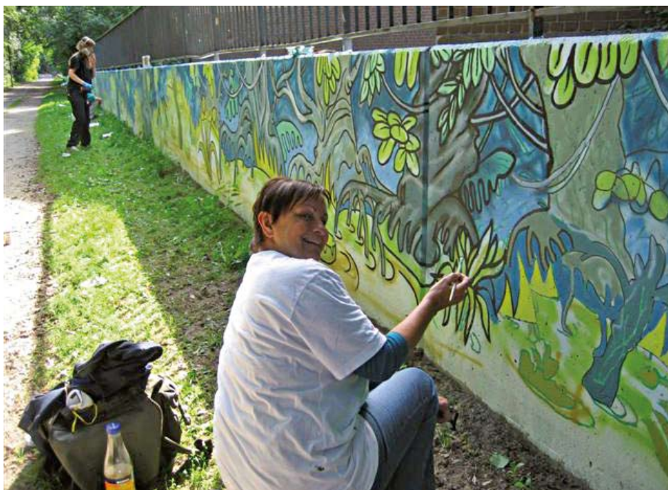
Malen macht Laune.