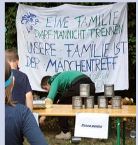
Der Protest des Mädchentreffs Lurup gegen geplante Kürzungen war inzwischen erfolgreich!

Der SoVD Hamburg wendet sich gegen die Sparmaßnahmen auf dem Rücken derer, die ohnehin zu wenig haben und auf die Angebote in den Bezirken angewiesen sind. „Gespart wird in einer Zeit sprudelnder Mehreinnahmen, die eher mehr ermöglichen. So stehen dem Senat 360 Millionen zusätzliche Steuereinnahmen und mindestens 150 Millionen Euro aus der Grundsicherung im Alter und Ein-