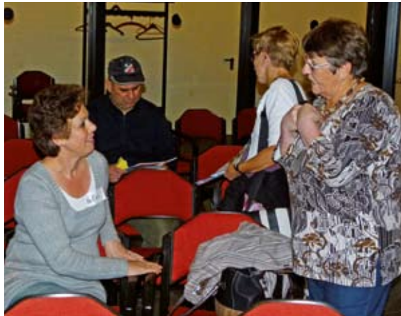
Was brauchen wir?

B raucht der Born die Wiederaufnahme in das Programm zur integrierten Stadtentwicklung (RISE)? Ja! Welche Problemlagen sollen behandelt werden? Dies herauszufinden war Absicht der diversen Bürgerbeteiligungsveranstaltungen, die im Auftrag des Bezirksamts Altona von der Firma GEWOS durchgeführt wurden. Nach einer Veranstaltung im DRK-Zentrum speziell für BewohnerInnen mit Migrationshintergrund und einer Befragung im Born Center waren am 4. September alle Anwohner in die Maria-Magdalena-Kirche eingeladen worden, um noch einmal ihre Wünsche einzubringen. Die Schwerpunktthemen, die in gesonderten Arbeitsgruppen behandelt wurden, waren „Der Bornpark“, „Querung der Bornheide und Gestaltung eines Neuen Bornzentrums“ und „Alltagswelt der Bewohner“. Einigkeit bestand bei den Beteiligten darin, dass der Bornpark unbedingt in das Förderprogramm aufgenommen werden muss. Die Spiel- und Grillplätze bedürfen dringend der