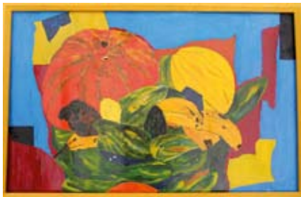
Sabine Mumm: Herbststilleben