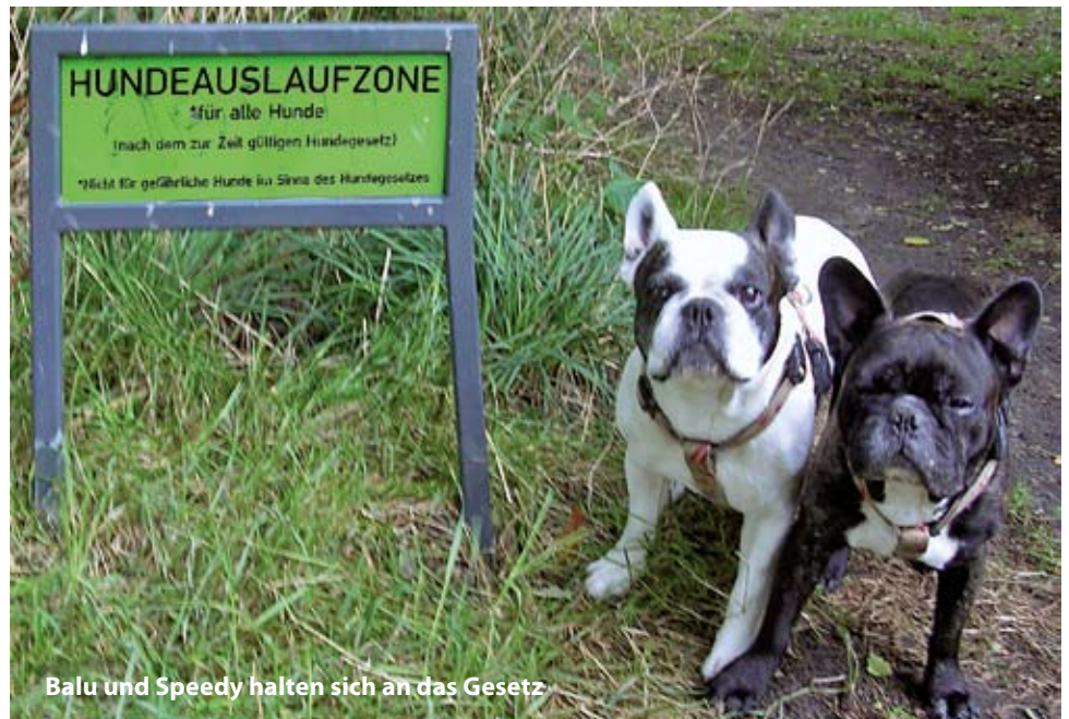
Balu und Speedy halten sich an das Gesetz

Ansonsten dürfen auf den öffentlichen Grünflächen, also auch im gesamten übrigen Bornpark, Hunde nur an der Leine und auch nur auf den Wegen geführt werden. Rasenflächen und der Spielplatz dürfen mit Hunden nicht betreten werden. Auch in der gesamten Feldmark südlich des