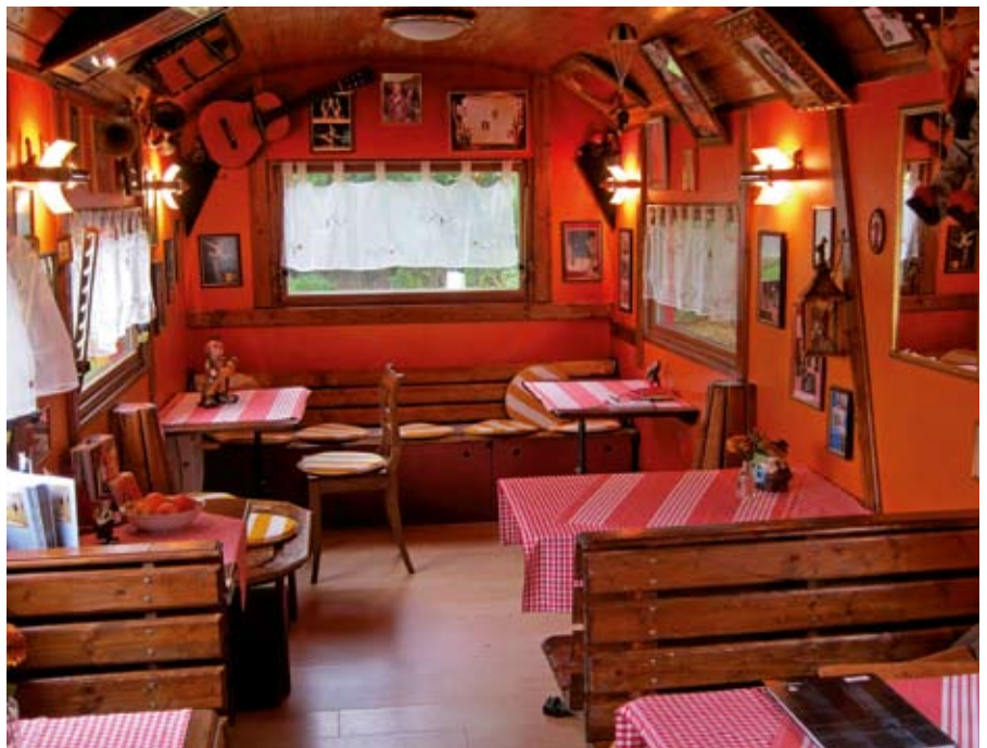
Zirkuswagen-Ambiente: Hier schmeckt das Essen.

Kann man sich als Gast das Mittagessen leisten? Es kostet 5 Euro, für Menschen mit geringem Einkommen 3,50 Euro. Zurzeit ist das Zirkus-Café dienstags und donnerstags von 12-18 Uhr geöffnet, es gibt auch Kaffee oder Tee und selbstgebackenen Kuchen. Die Betreiberinnen würden die Öffnungszeiten gerne ausdehnen – das hängt vom