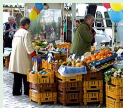
Bald auch an der S-Bahn Sülldorf?