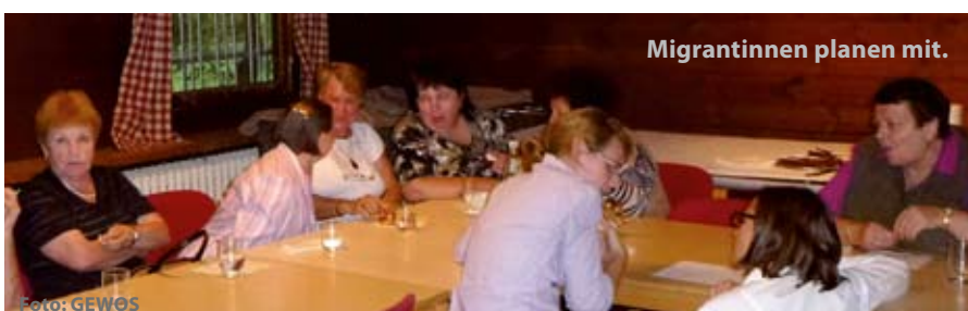
Migrantinnen planen mit.