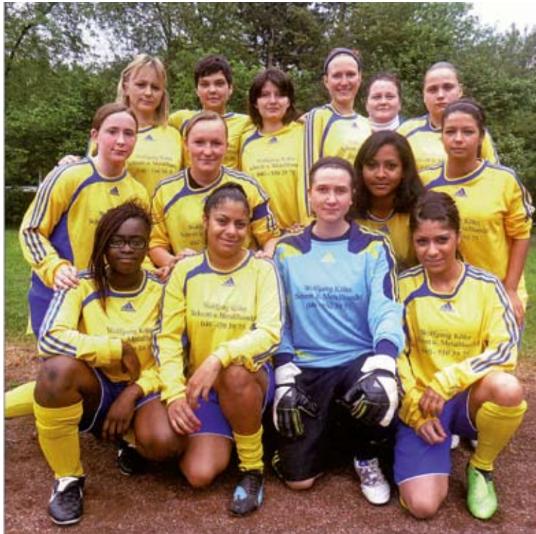
14 fröhliche Damen feiern den Aufstieg in die Verbandsliga

viele Erfolge vorweisen kann und ja schon oft im Stadtteil aufgetreten