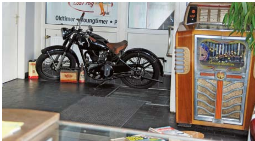
Ein Hauch von Nostalgie