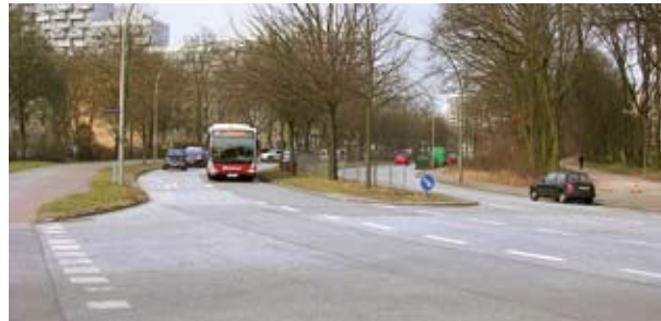
In der Bornheide stehen die Busse nie im Stau.

(2) Eine weitere Maßnahme zur Busbeschleunigung ist die Anla-