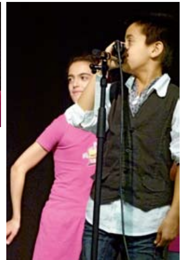
Fetzige Rhythmen vom Leadsänger

ner im neuen Gebäude Jugendmusikschule, Kita und Schulärztlichen Dienst. Und die Schulleiterin sprach einen herzlichen Dank aus: an die Kolleginnen und Kollegen, an Schulbau Hamburg und nicht zuletzt an die Geldgeber!