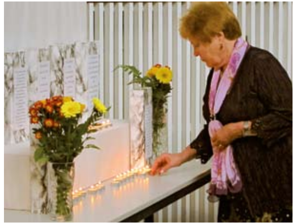
Kerzen für die Opfer der Deportation