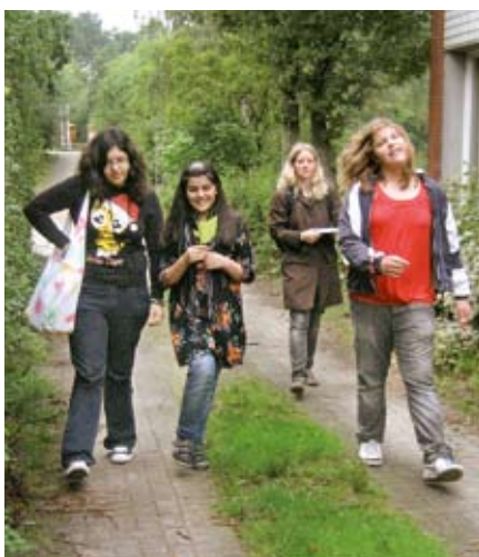
Auf zur Geländeerkundung

40 Kinder und Jugendliche zwischen sieben und 14 Jahren waren an diesem Prozess beteiligt. Sie kamen aus dem Spielhaus Bornheide, dem Circus ABRAX KADABRAX, der Vereinigung Pestalozzi, der Geschwister-Scholl-Stadteilschule (Klasse 7c und 8d) und dem ASB-Mädchentreff. So haben zum Beispiel die Schülerinnen und Schüler der Geschwister-Scholl-Stadteilschule in einem dreistündigen Workshop unter der Leitung von Frau Edelhoff und Frau Vogelsang von JAS WERK eingehend das Gelände um das zukünftige Bürgerhaus erkundet und dann Entwürfe zur Verschönerung des Freigeländes erstellt. Ihre Ideen und Entwürfe haben sie auf dem Workshop zur Gestaltung des Außengeländes am 28.9. vorgestellt (s. Artikel S. 4). Nun liegt es an dem mit dem Umbau beauftragten Architekturbüro zu überprüfen, welche Ideen der Kinder und Jugendlichen realisiert werden können.