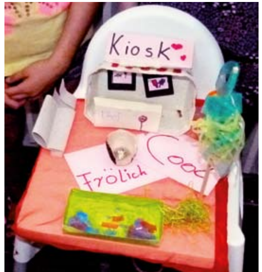
Viel Zustimmung für den Kiosk