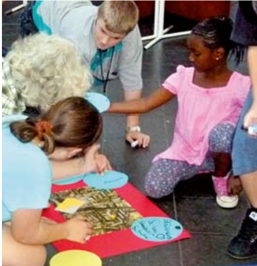
Welcher Vorschlag soll einen Punkt bekommen?