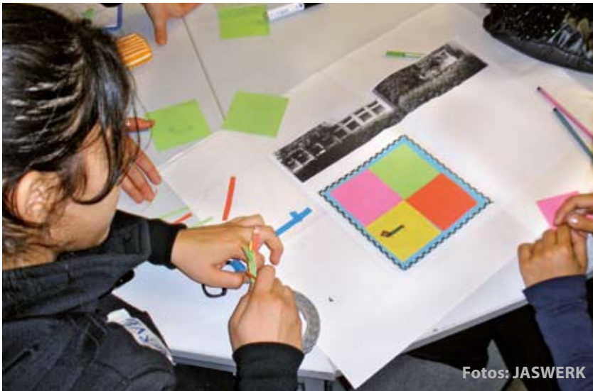
Die Wünsche aufs Papier bringen