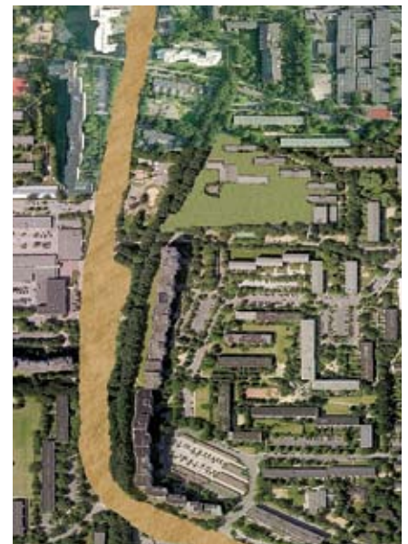
Zurück zum Acker...

Auch zum Dauerbrenner öffentlicher Personennahverkehr wird es bereits am 18.10. ein Treffen für alle interessierten Bürger geben. Schulkinder, die wegen überfüllter Busse nicht nach Hause kommen (Linie 21), an der Trabrennbahn gestrandete Borner, für die der Heimweg nach Kino oder Theater nicht immer einfach ist (Linie 3) – eine Umgestaltung der ÖPNV-Anbindung des Osdorfer Borns ist dringlich! ltw