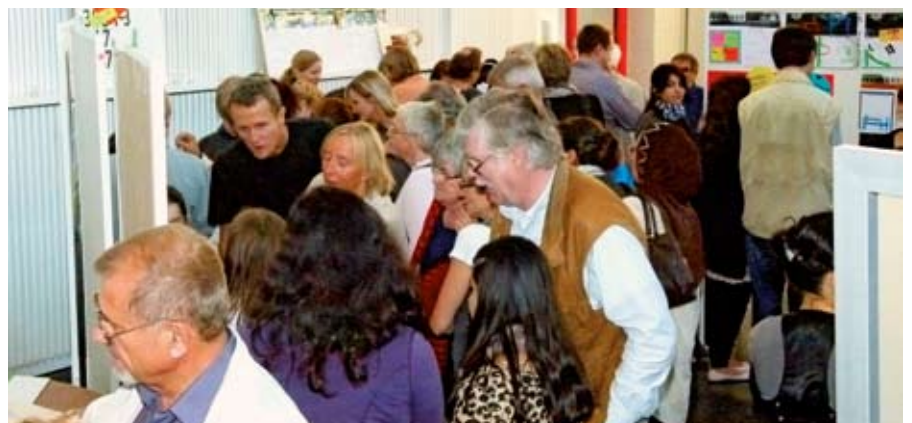
Großes Interesse an der Präsentation der Vorschläge für die Geländegestaltung

Die Dokumentationen zum Workshop finden Sie unter http://www.westwind-hh.net/Bilder.html /tw