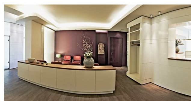
Neben qualifizierter Ausbildung und modernster Ausstattung steht auch ein Ambiente zum Wohlfühlen im Vordergrund

Für gesunde und strahlend schöne Zähne sorgt das Team um Monika Löblich und bietet professionelle Lösungen auf dem neuesten Stand der modernen Zahnmedizin. Das Leistungsspektrum der Zahnarztpraxis beginnt bei Prophylaxe und reicht über Parodontitisbehandlung, moderne Endodontie sowie ästhetische Zahnbehandlungen bis zu moderner Prothetik. In der Praxis geht es jedoch um noch mehr – individuelle, sanfte, aufklärende Betreuung und Behandlung sind Voraussetzungen dafür, dass Patienten mögliche Ängste hinter sich lassen und den Weg zu gesunden und schönen Zähnen gehen.