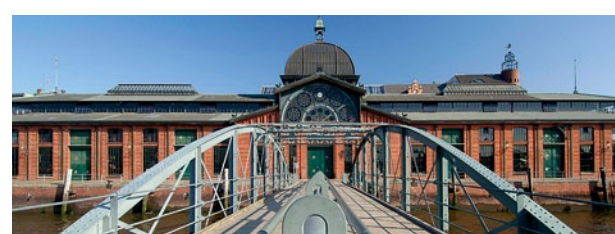
Die historische Fischauktionshalle ist heute Ort vieler Veranstaltungen

Die Elbmeile in Hamburg erstreckt sich über eine Länge von 2,6 Kilometern – angefangen beim weltberühmten Fischmarkt, die Große Elbstraße entlang über Neumühlen, endet Hamburgs maritimste Erlebniswelt am Museumshafen in Oevelgönne. Ein Aufenthalt auf der Elbmeile macht aus jedem Besucher einen Kurzurlauber und zeigt, warum Hamburg das „Tor zur Welt“ genannt wird. Freuen Sie sich auf Stil und Vielfalt, individuelle Lebensart, maritimes Flair, Vitalität und Weltoffenheit und einen einzigartigen Mix aus Dingen, die jeden glücklich machen! Dieses Viertel versteht es, seine vielfältigen Wechselwirkungen zu einem urbanen Erlebnis werden zu lassen und avanciert damit zur prominenten Bühne der Hamburger Hafenkulisse. Der elbmeile Hamburg e.V. bündelt die Interessen der dort ansässigen Geschäftsleute und stärkt den gemeinschaftlichen Charakter. Online findet der Besucher geschichtliche Aspekte zum Viertel sowie die aktuellsten Veranstaltungen.