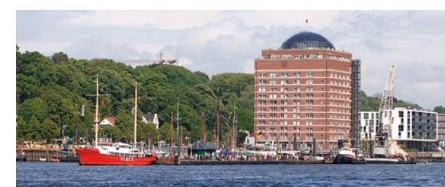
Erstklassige Betreuung mit schönem Elbblick

Unter dem Motto „Sie entscheiden“ unterhält das Augustinum 23 Standorte in ganz Deutschland. Das Hamburger Haus in exklusiver Lage am Elbufer verfügt über Rezeption, Restaurant, Schwimmbad, Sauna, Clubraum, Theatersaal sowie eigene Bibliothek und bietet vielfältige Anregungen in kultureller und geselliger Hinsicht. Gegebenenfalls erforderliche Pflege erfolgt dem Gesundheitszustand des Bewohners entsprechend im eigenen Apartment durch den hauseigenen Pflegedienst des Augustinum. Die gleiche hervorragende Service- und Betreuungsstruktur bieten zwei weitere Wohnstifte im Hamburger Umland und in der Region: Das Augustinum Aumühle liegt nicht weit von der Hansestadt entfernt in einem gründerzeitlichen Villenvorort, während das Haus in Mölln in unberührter Natur inmitten der Lauenburgischen Seenplatte gelegen ist.