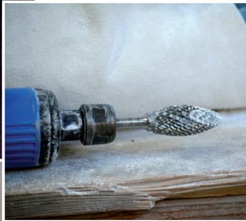
Ein kleiner, handlicher Dremel zum Schleifen.