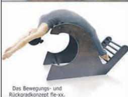
Das Bewegungs- und Rückgradkonzept fle-xx.