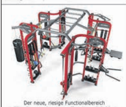
Der neue, riesige Functionalbereich mit TRX, Rope und weiteren Trainingsmöglichkeiten.

GROSSE NEUERÖFFNUNG NACH TOTALUMBAU im Bargkoppelweg