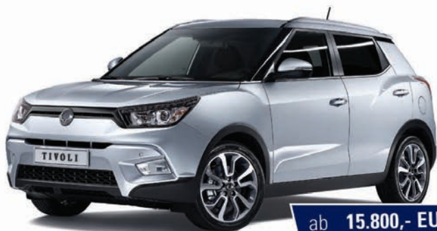
Abb. zeigt kostenpflichtige Sonderausstattung

ab 15.800,- EUR 1 inkl. 5 JAHRE GARANTIE 2