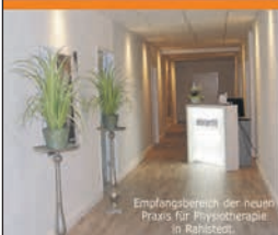
Empfangsbereich der neuen Praxis für Physiotherapie in Rahlstedt.

Fitness – Kurse – Physiotherapie – Wellness – Sauna