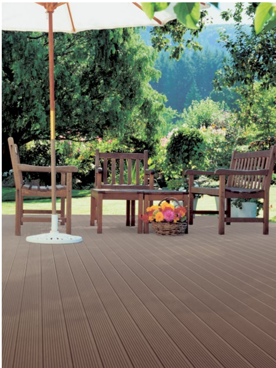
Pflegeleicht und Langlebig – Terrassendielen aus Holz-Polymer-Werkstoffen.

Tip: Welche Vielfalt der innovative Werkstoff bietet, zeigt der Film „WPC – Das Beste aus zwei Welten“ (Link: https://www.youtube.com/watch?v=g19-E9QU56U ).