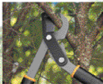
PowerGear Bypass-Getriebeastschere (80 cm)