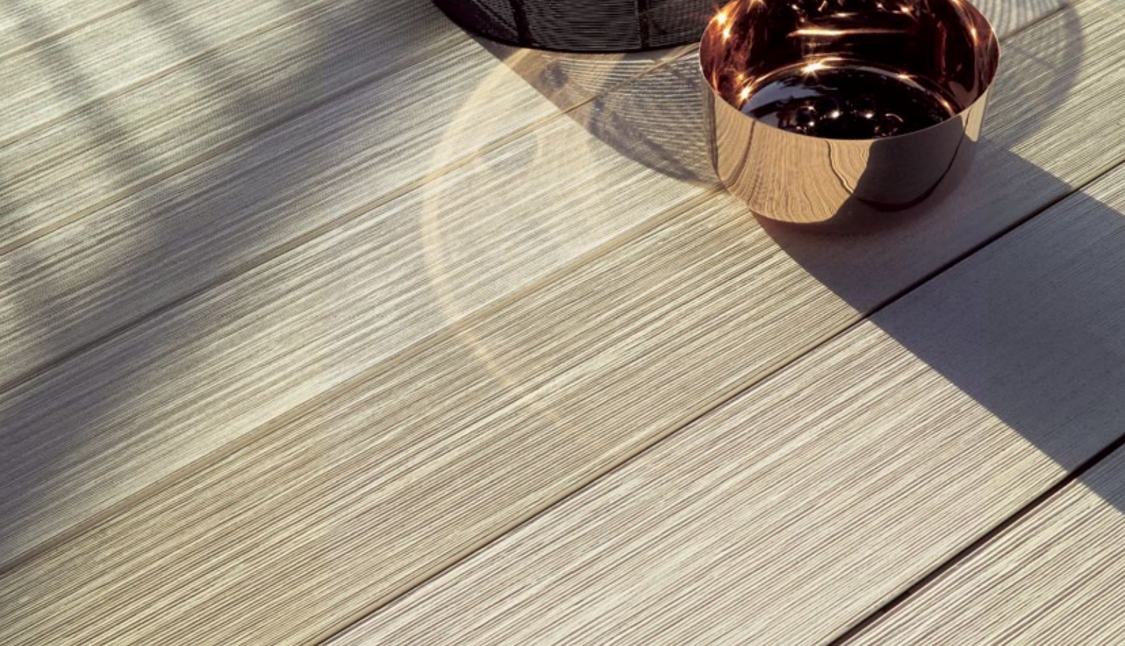
Terrassendiele Plexiglas® Wood-Mydeck