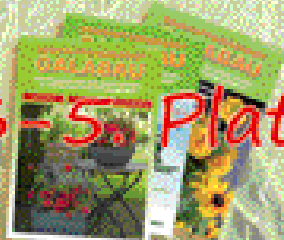
je ein Jahresabo unserer GALABAU-Zeitschrift