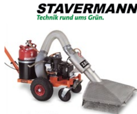
Handgerät UKB 650

Die Geräte UKB 1000/1200/1400 werden an einem Trägerfahrzeug nach Wahl, z. B. Ge-