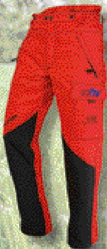
Everest Pro Schneidhose