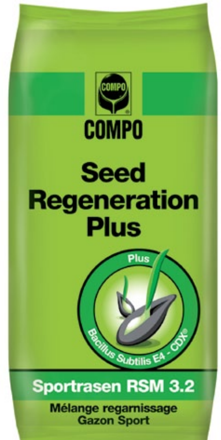
COMPO Seed Regeneration Plus mit Bacillus subtilis, Selektion E4-CDX® für eine schnellere und sichere Keimung.

Übrigens: COMPO EXPERT stellt auf der Messe demopark+demogolf vom 21. bis 23. Juni 2015 in Eisenach den Rasen-Langzeitdünger Rasen Floranid® für die Düngung der Demonstrationsflächen zur Verfügung.