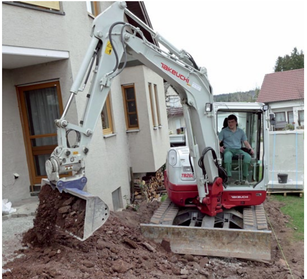
Der Takeuchi TB 260 bietet viele Ausstattungsmerkmale, wie beispielsweise Powertilt, Schnellwechsler und Symlock Adapter, die Manuel Kappler intensiv nutzt, um effizienter arbeiten zu können.

Ausstattung, Kraft und Vielseitigkeit auf höchstem Niveau, das ist der Takeuchi TB 260. Ausgerüstet ist der 5,7 t Kompaktbagger mit einem 32,4/43,4 kW/PS starken Motor und vier hydraulischen Zusatzkreisläufen. Die Hammerhydraulik ist serienmäßig mit einem automatischen Rücklaufventil ausgestattet. Zum schnellen Arbeiten gibt es einen hydraulischen Schnellwechsler und den Powertilt mit einem Arbeitsbereich von 2 x 90°. Extra starke Bolzen und Buchsen mindern den Verschleiß ebenso wie hochwertige Laufwerkskomponenten und Gummiketten. Er hat eine geräumige Kabine mit Klimaanlage, 5-fach verstellbarem Komfortsitz, einziehbarer Frontscheibe u.v.m. Hier macht es Spaß zu arbeiten. In die Joysticks sind die Bedienelemente für die Zusatzkreisläufe und die Fahrstufenschaltung integriert. Die Motorhauben aus Stahlblech sind robust und weit zu öffnen. Optionale Zusatzausrüstungen machen den vielfältig und hochwertig ausgerüsteten Takeuchi TB 260 noch perfekter. Dadurch ist er in vielen Branchen mit höchster Effizienz einsetzbar.