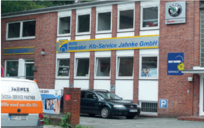
Neuer Standort und neuer Name: Kfz-Service Jahnke im Moosrosenweg 3

Das Autohaus Jahnke hat seine Tore am Bramfelder Dorfplatz geschlossen. Service rund um Rad, Reifen und Motoren bietet jetzt der Kfz-Service Jahnke. Seit dem 03. August finden Kunden die Werkstatt im