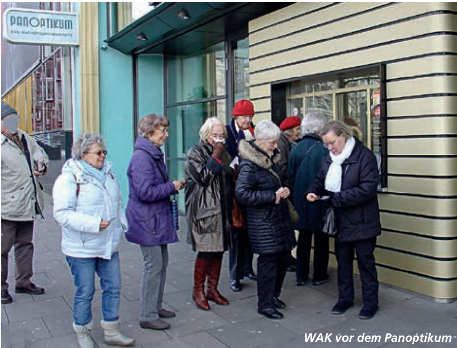
WAK vor dem Panoptikum

den grünen Augen von Robbie Williams. Nach einer guten Stunde hatten wir den sehr interessanten Rundgang beendet und wanderten über das Heiligengeistfeld am Millerntor-Stadion und dem Bunker vorbei zur Rindermarkthalle. Dort haben Hamburgs Hobby-Köche seit September 2014 ein neues Mekka in Hamburgs erstem überdachtem Wochenmarkt: ein Ort zum Riechen, Schmecken und Entdecken – ganz ohne Fastfoodketten und standardisierten Coffeeshops. Es gibt das älteste Haushaltswarengeschäft Hamburgs, einen Fischhändler, einen Metzger, einen Blumenstand, einen Obst- und Gemüsehändler, Wein und kleine Stände mit internationalen Spezialitä-