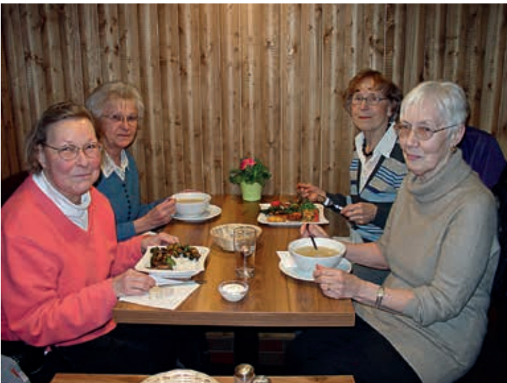
Beim „Schmecken“ in der Rindermarkthalle

ten – ein Angebot wie auf dem Markt, nur wetterfest und die ganze Woche über geöffnet. Eingeraht wird die Halle von einigen großen Discountern. So etwas gab es in Hamburg bisher nicht. Ein Besuch dort lohnt sich auf jeden Fall!