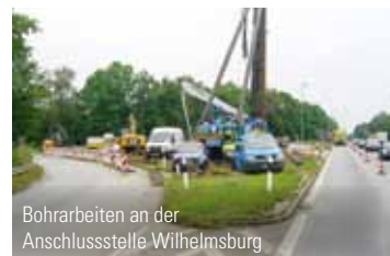
Bohrarbeiten an der Anschlussstelle Wilhelmsburg

Bauarbeiten auf einer Karte dargestellt. Auf der letzten Seite finden Sie ein paar Fachbegriffe erläutert, die Ihnen vielleicht noch nicht so geläufig sind. Wie immer