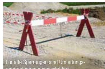
Für alle Sperrungen sind Umleitungsempfehlungen ausgeschildert

beim Bauen kann es witterungsbedingt zu kleineren Abweichungen bei den genannten Bautermeninen kommen. Und das nicht nur durch die Baustelle selbst, sondern auch durch eine im Umfeld, die dann den Zeitplan der benachbarten beeinflusst. Wir sind jedoch zuversichtlich, dass die Arbeiten auch unter Berücksichtigung der Baustelle auf der Bundesautobahn A1 und den Baustellen von Hamburg Port Authority in Wilhelmsburg den Verkehr mit nur geringen Beeinträchtigungen fließen lassen und so bis zur Ausstellungseröffnung von igs 2013 und IBA alles fertiggestellt ist.