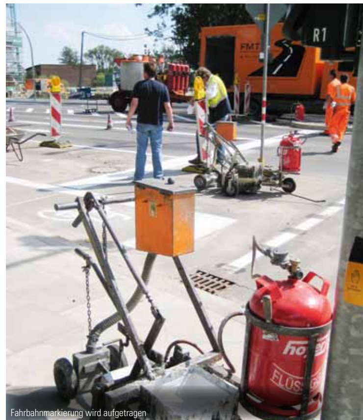
Fahrbahnmarkierung wird aufgetragen

Bauarbeiten auf Straßen laufen in der Regel nicht ohne Verkehrsbehinderungen. Der Landesbetrieb Straßen, Brücken und Gewässer – LSBG – versucht jedoch, die Einschränkungen so gering wie möglich zu halten. In den Monaten August bis November 2012 werden Sie also auf Wilhelmsburgs Straßen die eine oder andere Umleitungsempfehlung lesen können. Diese Bauinfo gibt Ihnen hierzu eine