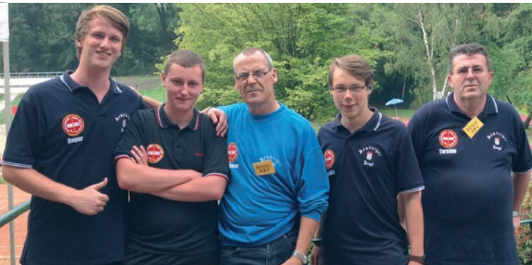
drei Jugendlich des HMC mit Vorstandsmitgliedern

Dass Minigolf nicht nur ein Freizeitvergnügen, sondern auch ein Hochleistungssport ist, zeigten am 5. Juli die jugendlichen Spieler des HMC bei der Deutschen Jugendmeisterschaft in Wanne-Eickel. Erstmals seit über zwanzig Jahren stellte Hamburg wieder eine Mannschaft. Leider wurden die Spieler Opfer des schlechten Wetters und