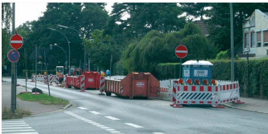
Baustelle für neue Wasserleitungen

Da bleibt nur noch zu sagen: Hummel, Hummel- M....- M..., oh Verzeihung, ich meine natürlich Wasser marsch !