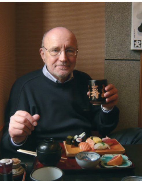
mit einem japanischen Frühstück in den Tag

Ein Bürgerverein in Japan übernimmt bestimmte karitative Aufgaben für Behinderte, Senioren und Kinder. So betreibt er z.B. einen kleinen behindertengerechten Bus, der mehrmals am Tag kostenlos im Bezirk verkehrt. Der Verein organisiert