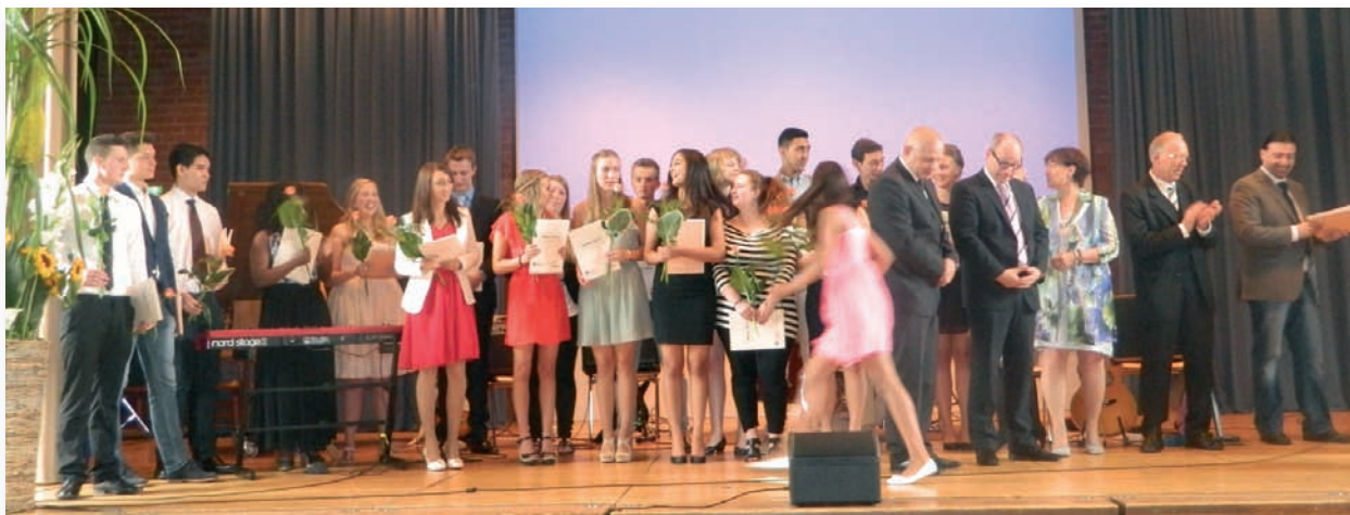
Verteilung der Zeugnisse