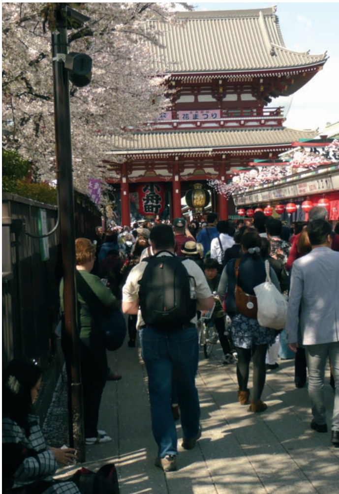
belebte Fußgängerzone in Tokio

Ich muss nun ein wenig auf die Abfahrt meines Busses