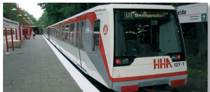
U-Bahn Station (Fotomontage)

Jetzt erfuhren wir aus dem Abendblatt und dem Sender NDR 90,3 dass mit dem Bau der Haltestelle bereits im Jahr 2017 – früher als man es vermuten konnte – begonnen werden soll. Bleibt zu hoffen, dass das stadteigene Unternehmen HVV die Verwirklichung der Planung einhält und mit diesem Bauvorhaben mehr Fortune hat als es bei der einen oder anderen Baustelle der Stadt zu erkennen ist.