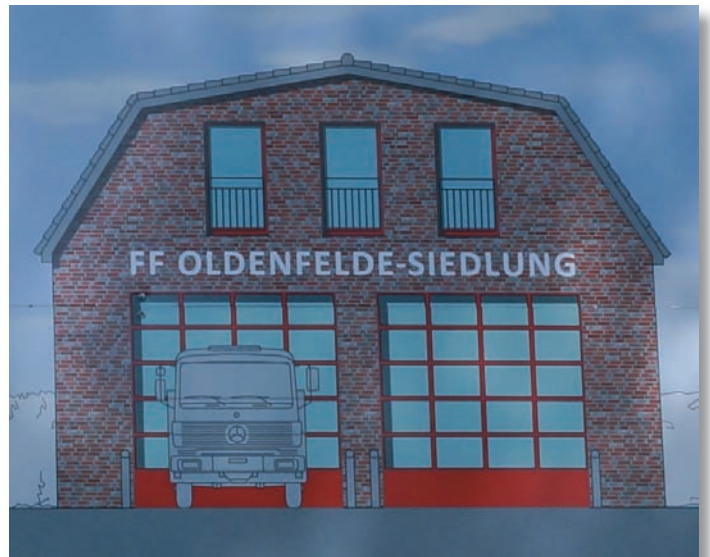
neues Feuerwehrhaus FF Oldenfelde-Siedlung

Endlich geht es los! Nach nun mehrjähriger Vorplanung wurde Ende Juli mit dem Abriss für einen Neubau des Gerätehauses am bewährten Standort in der Bekassinenua begonnen.