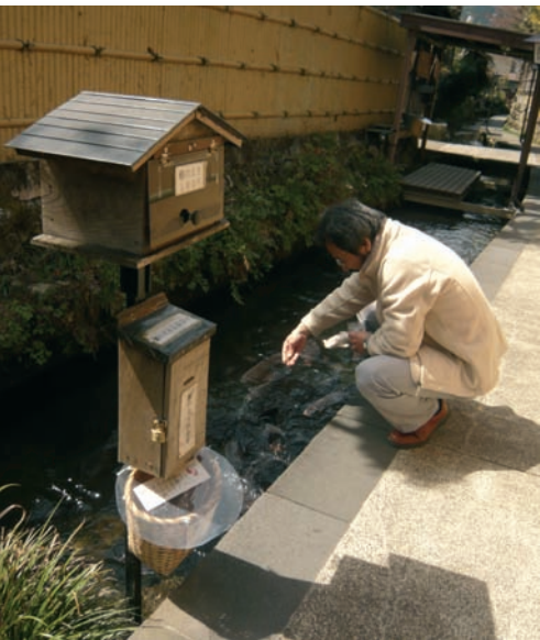
Fütterung freischwimmender Koi-Karpfen

gehupt. Die Menschen bewegen sich zielstrebig, aber nicht hektisch.