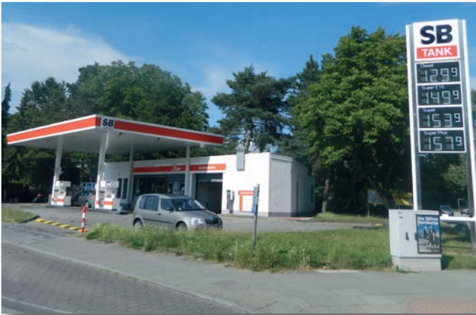
neue SB Tankstelle

Seit Anfang Juli gibt es eine neue "freie Tankstelle" in Oldenfelde an der Einmündung Alter Zollweg / Bekassinenu. Dort hat die Shelltankstelle ihren Betrieb aufgegeben. Um beim Betanken des Fahrzeuges zu sparen, ist man ja aufgefordert, nach der jeweils günstigsten Tankstelle Ausschau zu halten. Jetzt hat der Redakteur des O-Blattes die Möglichkeit, im wahrsten Sinne "um die Ecke" zu tanken, was ihn freut. Der bisherige Cent-Vorteil an einer entfernten freien Tankstelle wurde durch die längere Fahrt dorthin weitgehend zunichte gemacht.