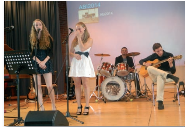
musikalischer Beitrag der Schulband