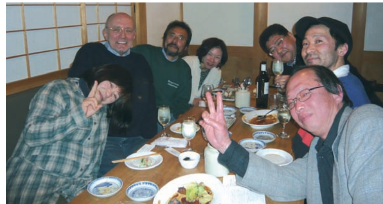
in fröhlicher Sake-Runde