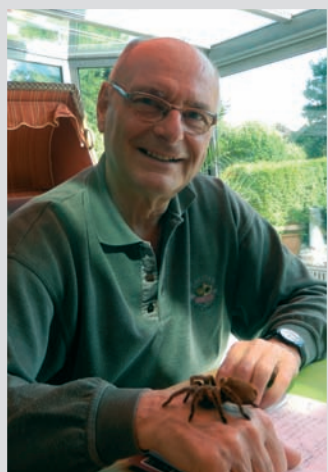
Herr Haushalter mit Vogelspinne