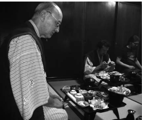
im Schneidersitz ist nicht gut essen

Nachdem wir unser Zimmer eingerichtet haben, besuchen wir den örtlichen Ocen. Das ist ein Badehaus, dessen Wasser aus heißen Quellen mit einem hohen Mineralanteil gespeist wird. Das sehr heiße Wasser (über 40° C) macht müde, und so legen wir uns noch ein wenig auf die Strohmatten (Tatami) unseres Zimmers und schlafen vor dem Abendessen ein wenig ein.