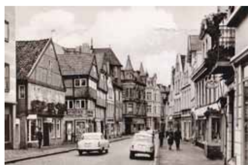
Mohnhof Ecke Sachsenstraße um 1960.