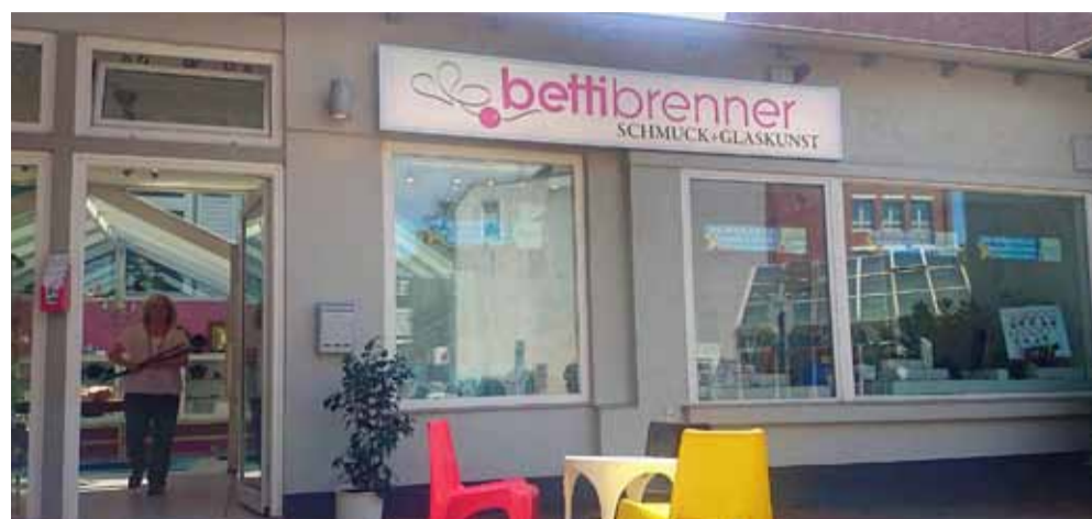
Die Schmuck- und Glaswerkstatt an der Chrysanderstraße 2 c.

Wie das funktioniert kann auch bei Schmuck+Glaskunst in der Chrysanderstraße erlernt werden. Bettina Brenner und ihr Team bieten über das Jahr verteilt zu festen Terminen immer samstags spezielle Kurse an. Hierbei stehen parallel vier Arbeitsplätze zur Verfügung, eine vorherige Anmeldung ist daher unbedingt erforderlich. Wer nach einem Grundkurs bereits geübt ist, kann sogar einen Arbeitsplatz mieten und so weiterhin die eigene Geschicklichkeit schulen und verbessern. Aber auch für Gruppen können individuelle Termine vereinbart werden. So auch Fädelkurse bspw. für eine Geburtstagsgruppe von Kindern oder Jugendlichen. Einen guten Einblick in das Handwerk und die damit