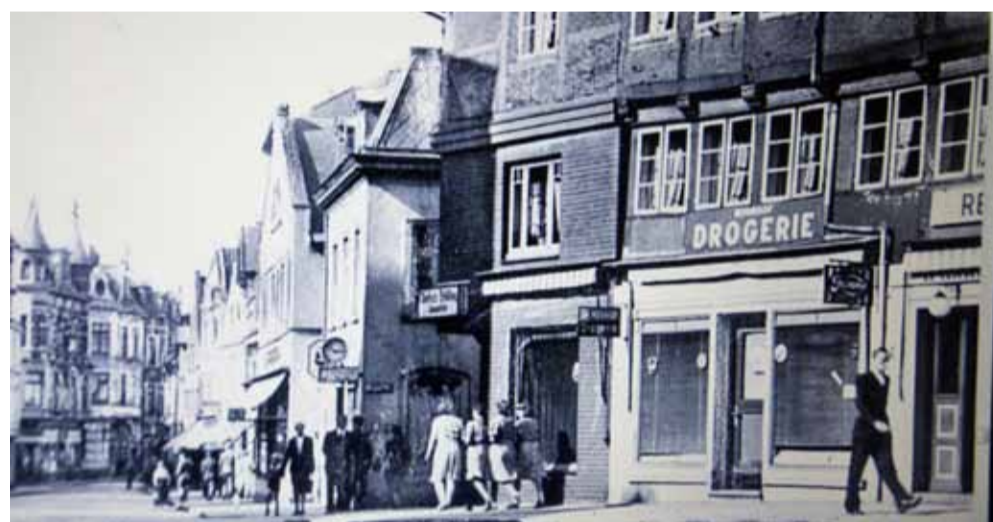
Ecke Chrysanderstraße um 1940 (oben) und Sachsenstraße in Richtung Mohnhof (unten).

die in den letzten Jahren hinzugezogen sind, sicherlich eine tolle Möglichkeit zu schauen, wie es früher in ihrer Nachbarschaft ausgesehen hat. Aktuell starten wir mit dem Bereich um den Mohnhof und dem Sachsenentor. Die historischen Aufnahmen wurden dem Stadtteilbüro freundlicherweise von Herrn Ronald Hartmann zur Verfügung gestellt, der auch weitere schöne Aufnahmen und Postkarten aus der alten Zeit in seinem Besitz hat. Werfen Sie mit uns gemeinsam einen Blick zurück, wie es zwischen 1900 und 1960 um Mohnhof und Chrysanderstraße ausgesehen hat.