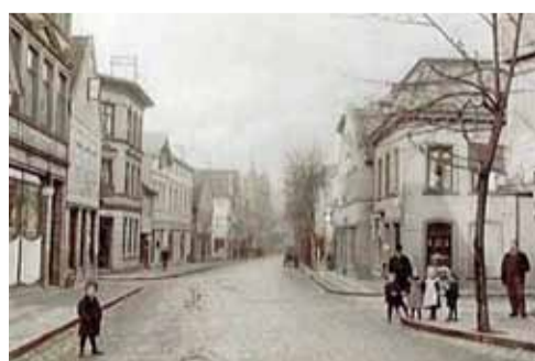
Sachsenstraße mit Abzweigung Chrysanderstraße um 1900.