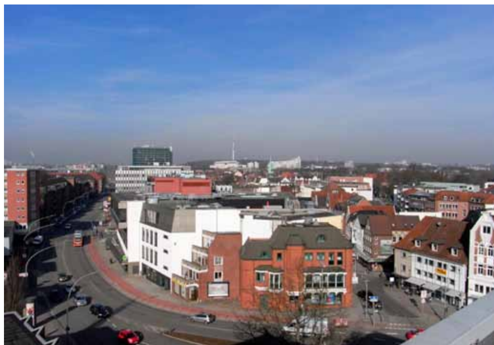
Bergedorf von oben: Das Panoramafoto.

Lassen Sie sich überraschen. Am 26. August wird das Panoramafoto erstmalig öffentlich vorgestellt. Seien Sie dabei und kommen Sie in den Beirat Bergedorf-Süd. Sie sind herzlich willkommen.