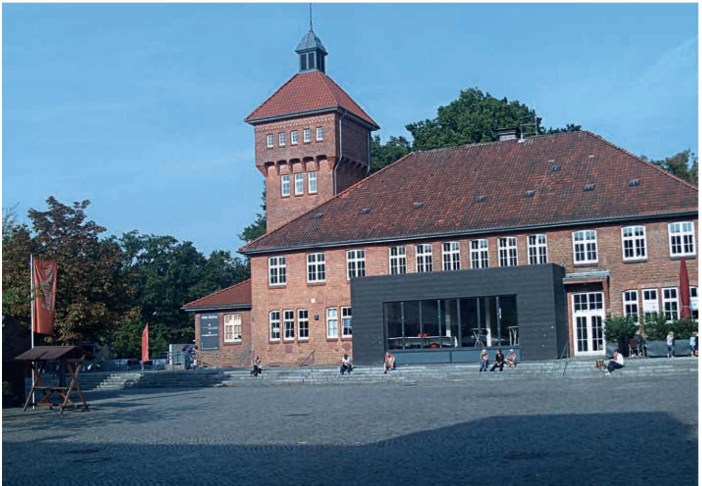
Die „Alte Küche“ am Alsterdorfer Markt