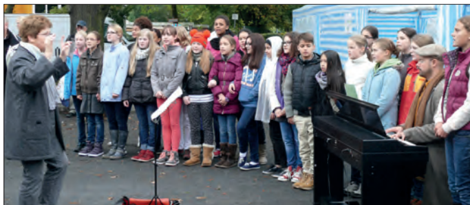
Musikalische Einstimmung durch den Unterstufenchor des Johannes-Brahms-Gymnasiums.