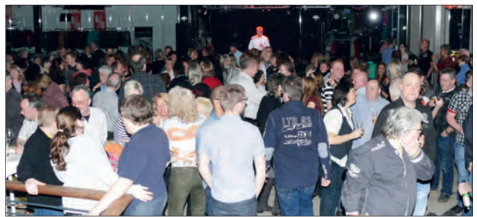
Auf den Tanzflächen und auch in den Gängen der Marktplatz Galerie Bramfeld herrschte überall reges Treiben.