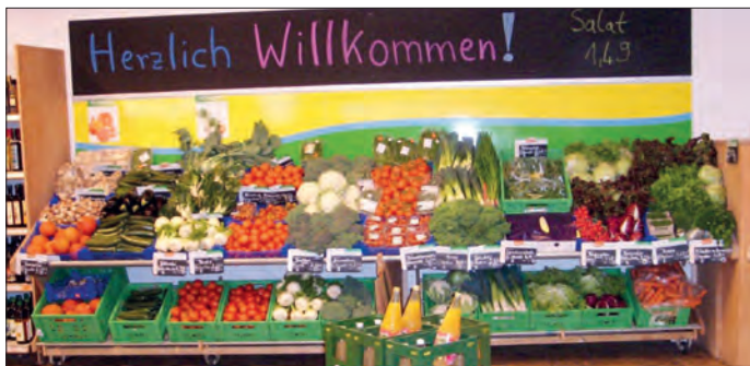
Knackiges Gemüse und frisches Obst: So wird es auch Ende Mai in der Filiale Bramfelder Chaussee 347 aussehen.