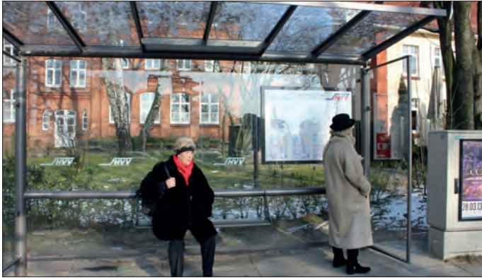
Das Schild vom Restaurant Diamanti verschwindet völlig hinter dem Fahrgastunterstand und dazugehörigem Fahrplan - diesen auf die andere Seite zu bringen wäre sicher auch möglich gewesen.

Die Geschichte des Fahrgastunterstands an der Bushaltestelle Bramfelder Dorfplatz ist lang, unerfreulich und mittlerweile am Ende angelangt. Am Ende angelangt ist auch Roberto Diamanti mit seinen Nerven und seinem Latein. Nun steht der Fahrgastunterstand doch an der denkbar ungünstigsten Stelle und nicht nur, dass kaum Fahrgäste ihn nutzen – er steht auch noch direkt vor dem Restaurantschild und verdeckt es. Seit kurzem hängt in dem Unterstand auch noch der Busfahrplan und dieser verdeckt dann vollständig den Schriftzug des Restaurants auf dem dahinter liegenden Schild. Tragisch und