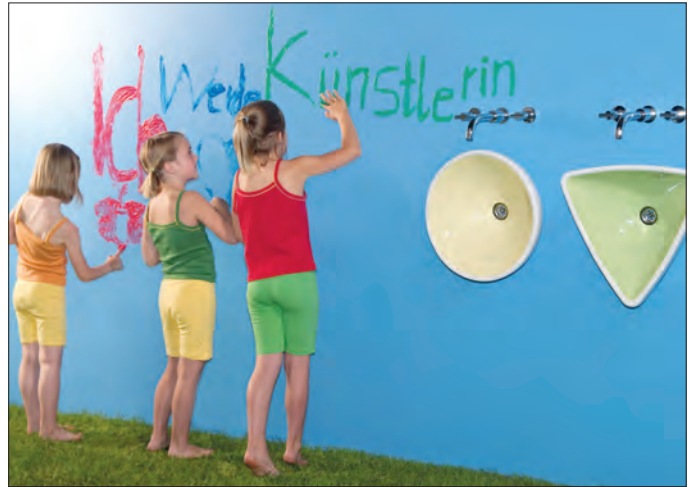
Mit der Schmutz abweisenden Oberfläche ceramicplus wird das Bad zum Erlebnisraum für Kids

Die Kids von heute haben es da besser. Sie dürfen ihrer Fantasie freien Lauf lassen und das Badezimmer als eigene Welt entdecken. Aber was ist mit dem Putzen und Saubermachen nach so einer Entdeckungsreise? Dem kann Mama - oder Papa - gelassen entgegensehen. Denn die innovative keramische Oberfläche ceramicplus, entwickelt von Villeroy & Boch, reagiert dank eines speziellen Veredelungsverfahrens abweisend auf Schmutz und Wasser. Sie verwandelt diese in abperlende Tropfen, die sanft und nahezu vollständig zum Ausguss rollen.