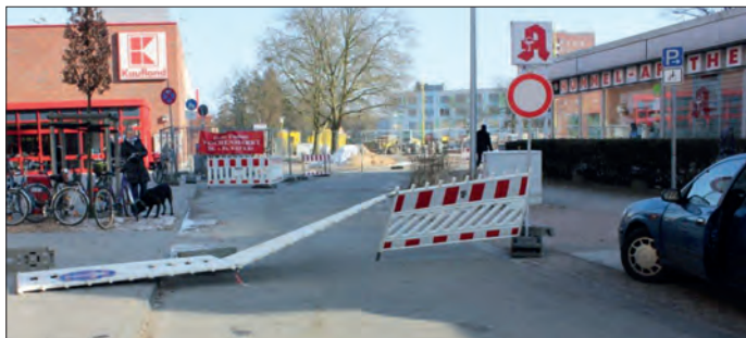
Einer der heftigen Windböen der letzten Wochen hat die Absperrung an der Herthastraße nicht standgehalten.

Wer in diesen Tagen versucht hat, mit dem Auto direkt vor das Ärztehaus am Bramfelder Marktplatz zu fahren, der wurde schon Meter zuvor enttäuscht und ausgebremst. Im Rahmen der Baumaßnahmen am Bramfelder Marktplatz musste jetzt auch der untere Teil der Herthastraße gesperrt werden. Die Baumaßnahme wird voraussichtlich noch bis einschließlich Juni 2013 andauern. Den Patienten/Besuchern des Ärztehauses stehen jetzt und künftig private Parkplätze direkt am Ärztehaus sowie zwei Parkplätze für Be-