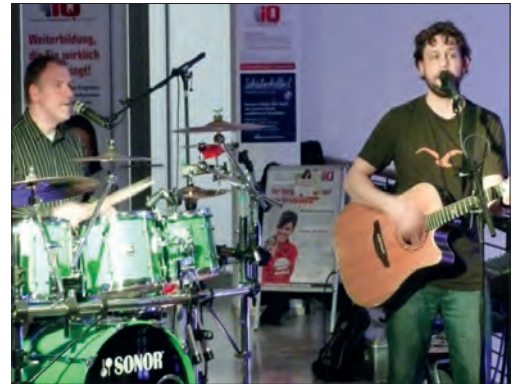
Das Duo St. Pauli

und der Live-Act „Georgie Carbutler“ für ausgelassene Stimmung. Die Oldie-Nacht mit Live-Musik war also wieder sehr erfolgreich und viele der Besucherinnen und Besucher warten schon jetzt auf die nächste TaMu-Nacht. Bramfeld hat also auch wieder einmal gezeigt, dass auch hier so richtig Party gefeiert werden kann.