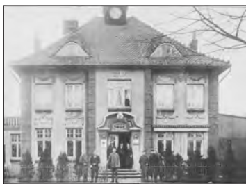
Aus Ulrike Hoppes Buch „Hamburg-Bramfeld“

Alle Gäste, die in diesem Haus gelernt oder geheiratet hatten, wurden vom Ehepaar Diamanti zu dem an diesem Sommerabend zu dem italienischen Büffet eingeladen.