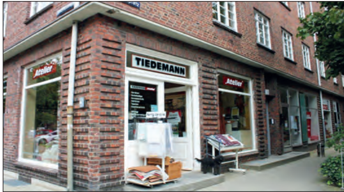
Hier am Hartzlohplatz 1 liegt das „Atelier“ Tiedemann.

Hier in der Barmbeker Idylle am Hartzlohplatz 1 liegt eines der vermutlich ältesten Raumausstatter-Geschäfte Hamburgs. 1914 wurde der Innenausstatter als Gardinen-Tiedemann ge-