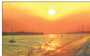
Abenduntergang auf der Elbe anlässlich unserer zweitägigen Helgoland-Fahrt Ende August.