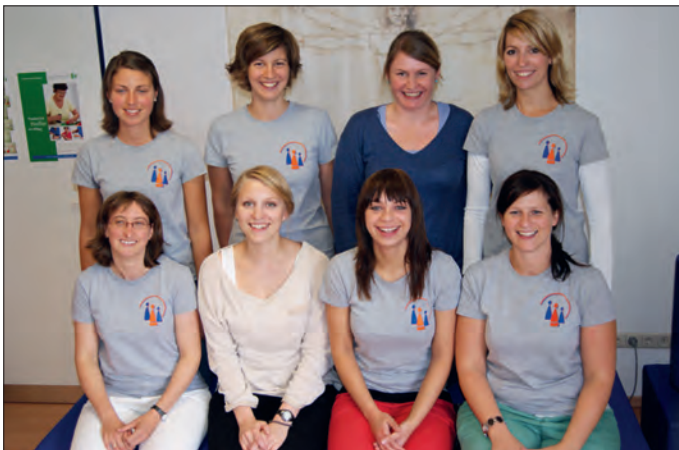
Das Team von Logopädie und Ergotherapie

Schluckstörungen bei Erwachsenen und Kindern.