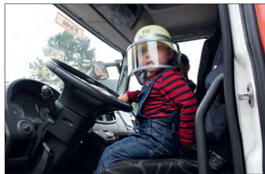
Für die Kleinsten das größte: Feuerwehrmann spielen.

Ein Jahr Planung war dem Fest vorausgegangen und am Festtag selbst