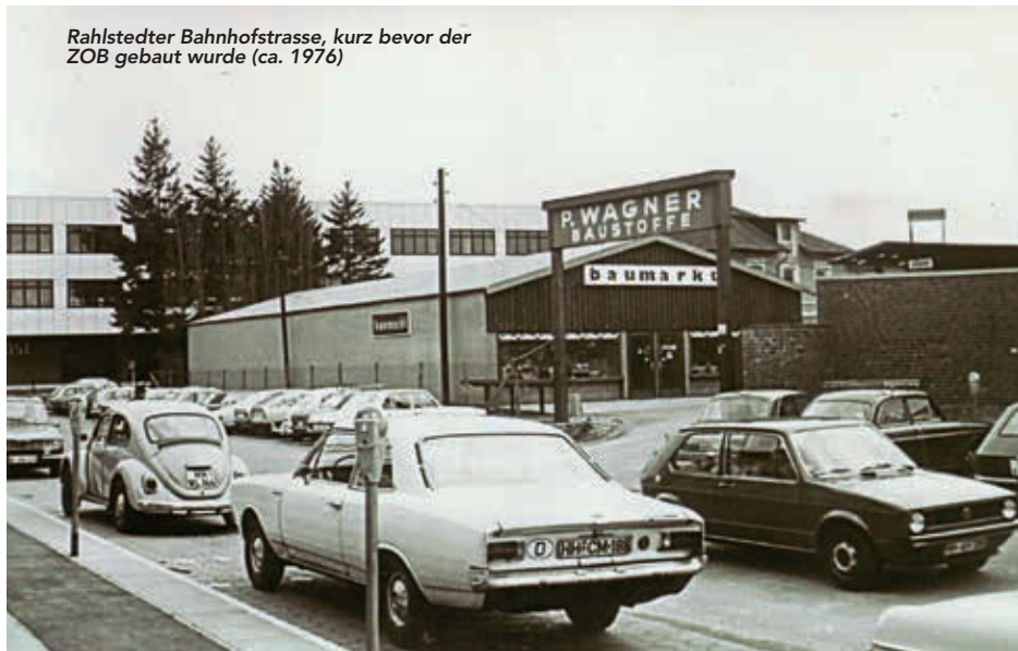
Rahlstedter Bahnhofstrasse, kurz bevor der ZOB gebaut wurde (ca. 1976)

- MetroBus-Linie 26 (Bf. Rahlstedt - Hamburg Airport): Die Linie wird zukünftig nicht mehr zum Flughafen, sondern nach U Kellinghusenstraße fahren. Diese Maßnahme dient der späteren Verknüpfung der MetroBus-Linien 20 und 26 mit einer