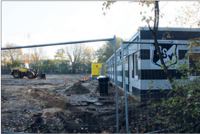
Noch sieht es aus wie ein landwirtschaftlicher Acker. Bald wird hier wieder eifrig trainiert.

Der Bramfelder SV ist mit ca. 4.000 Mitgliedern aus allen Altersbereichen der größte Sportverein in der Region Bramfeld und Steilshoop. In zahlreichen Sport- und Bewegungsgruppen engagieren sich fast 200 überwiegend ehrenamtlich tätige Trainer, Übungsleiter und Betreuer. Der Schwerpunkt des Angebots liegt im gesundheitsorientierten Freizeit- und Breitensport. Doch auch Wettkampf- und Leistungssport wird im Bramfelder SV erfolgreich betrieben. Die BSV Leistungsträger sind bei Hambur-