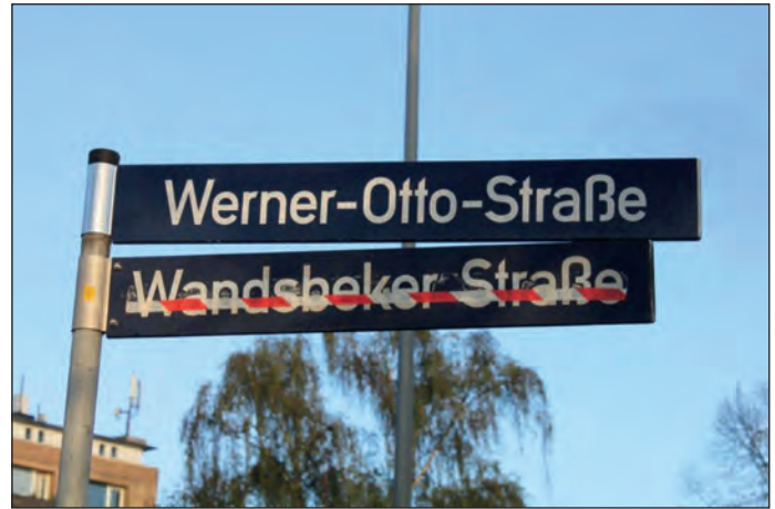
Seit August letzten Jahres heißt die Wandsbeker Straße nun Werner-Otto-Straße. Selbst die HVV-Busstation trägt jetzt diesen Namen.

Werner Otto ist 1909 in Seelow, Brandenburg, geboren und kam nach dem Krieg nach Hamburg, wo er eine der größten Versandhandelsgruppen der Welt gründete. Die Otto Group mit Sitz in Hamburg beschäftigt heute weltweit rund 54.000 Mitarbeiter in mehr als 20 Ländern. Werner Otto ist für seine unter-