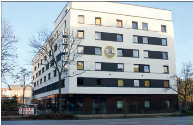
Imposant aber auch einladend steht es an der Kreuzung Bramfelder Straße / Habichtstraße.

Im Frühjahr noch prangte an der Kreuzung Bramfelder Straße / Ecke Habichtstraße eine riesige Baustelle. Mittlerweile hat das dritte B&B Hotel in Hamburg im Stadtteil Barmbek seine Pforten geöffnet. Der Jungfernstieg in der Hamburger City ist 17 Autominuten entfernt, mit U- und S-Bahn noch nicht einmal 30 Mi-