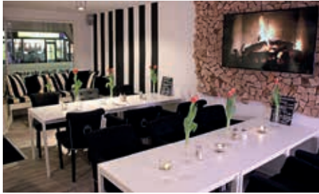
Blick im neuen Ambiente