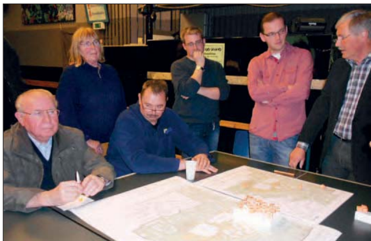
Die Arbeitsgruppe „Bramfelder Ortskern“ begutachtet die Pläne für die Neugestaltung des Marktplatzes in der Herthastraße.

Zehn Jahre ist es her, dass das Bezirksamt Wandsbek eine städtebauliche Rahmenplanung für den Bramfelder Ortskern durchgeführt hat. Besonders auf den privaten Flächen entlang der Herthastraße ist seither viel passiert: Die Firma Max Bahr hat ihr Stammgeschäft aufgegeben und ist nach Hell-