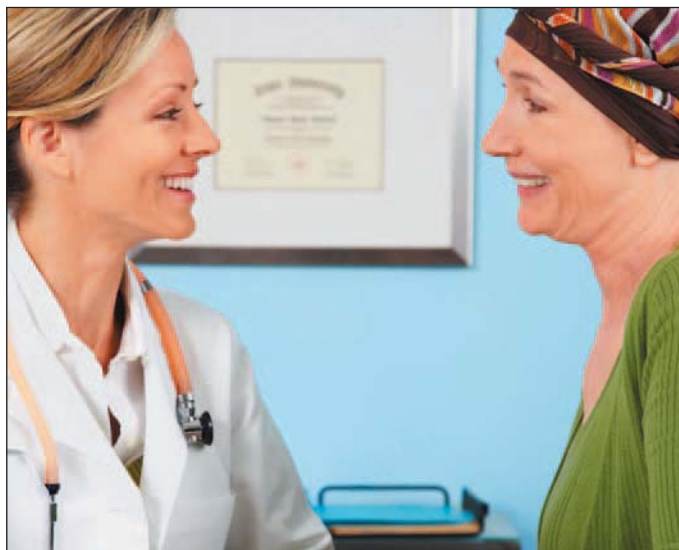
Durch regelmäßige Untersuchungen können Zellveränderungen rechtzeitig erkannt und behandelt werden.

gehen. Allerdings sorgen die Abstriche gerade bei Älteren immer wieder für Verunsicherung. Bei Patientinnen nach den Wechseljahren, die keine Hormone nehmen, ist der Befund manchmal nicht eindeutig.