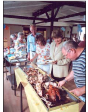
Lecker, lecker, lecker