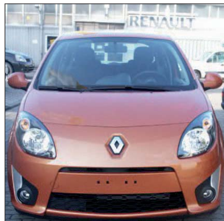
Der neue Twingo

Für geringere Kraftstoffrechnungen sorgt erstmals eine Dieselsonne (65 PS, CO 2 -Ausstoß: 113 Gramm pro km). Die Kraftübertragung erledigen eine Fünfgang-schaltung oder das automatisierte „Quickshift“-Getriebe. Der neue Twingo kostet ab 9250 Euro.