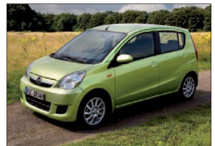
Der neue Cuore