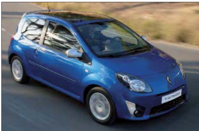
Der neue Twingo

Nach 14 Jahren ohne große Änderungen kommt Renault jetzt mit einem komplett überarbeiteten neuen Modell Twingo.