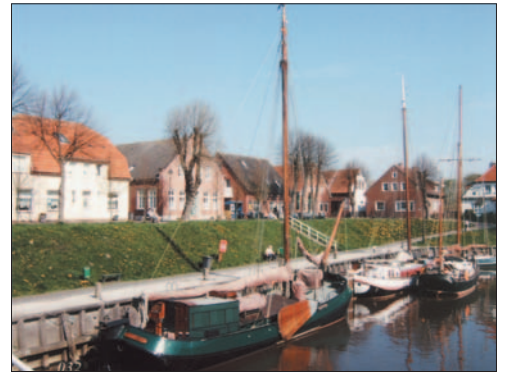
Blick auf den Museumshafen von Carolinensiel