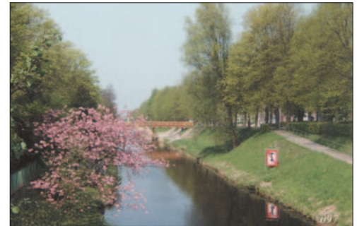
Emdener Innenstadt: 1944 zerstört, 1962 wieder aufgebaut