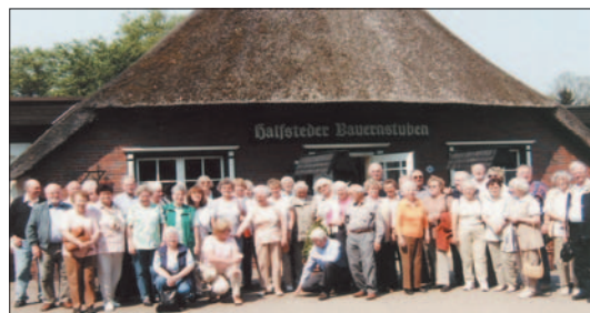
Gruppenaufnahme n. d. Mittagessen auf der Rückfahrt