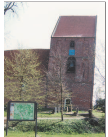
Der Kirchturm in Hinte soll der schiefste auf der ganzen Welt sein.