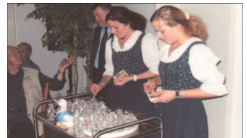
Ein echter „Friesengeist“ wird vor der Teezeremonie angezündet