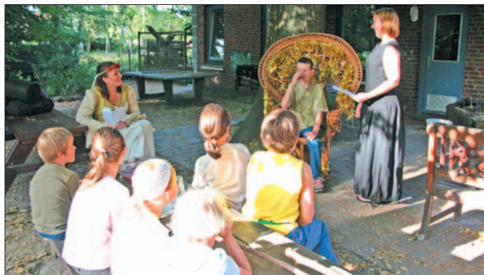
Hmmm, gar nicht lecker: Die Kinder mit geronnenem Drachenblut getauft.