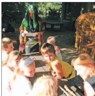
Hexe Halbera entführte die Bramfelder Ferienkinder auf Schatzsuche zu den Nibelungen

Ritter, Burgfräulein, Gaukler, Minnesänger und Märchenerzählen standen