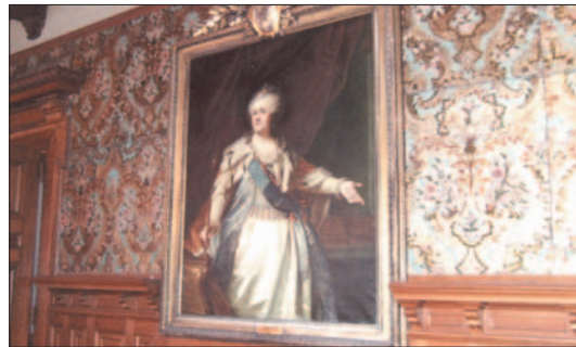
Das Fürstengeschlecht v. Anhalt-Zerbst prägte im 17. u. 18. Jahrhundert den Kulturraum Friesland