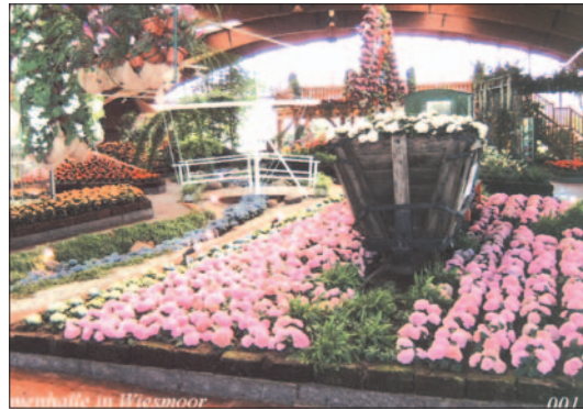
Farbenprächtige Blumenhalle in Wiesmoor