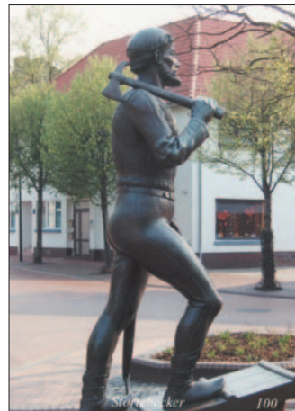
Störtebeker-Statue in Marienhafen