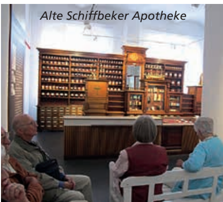
Alte Schiffbeker Apotheke