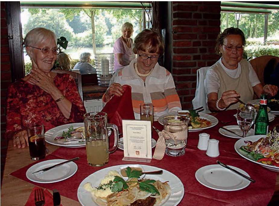
Im Restaurant Zum Bäcker