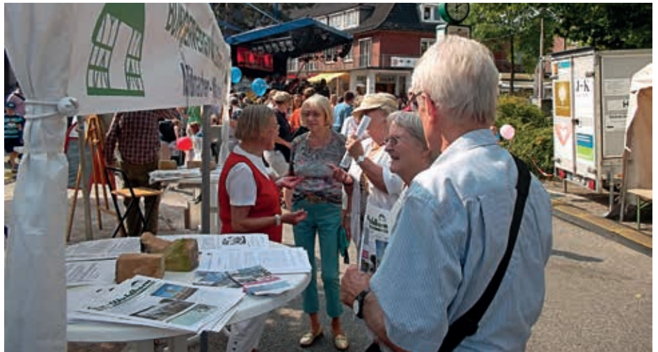
Viele Mitbürger informierten sich über das reichhaltige Angebot des Bürgervereins sowie unsere kulturellen und lokalpolitischen Projekte.