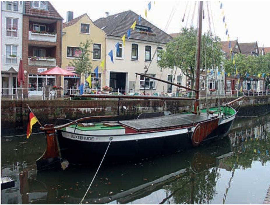
Giek-Ewer im Fleth