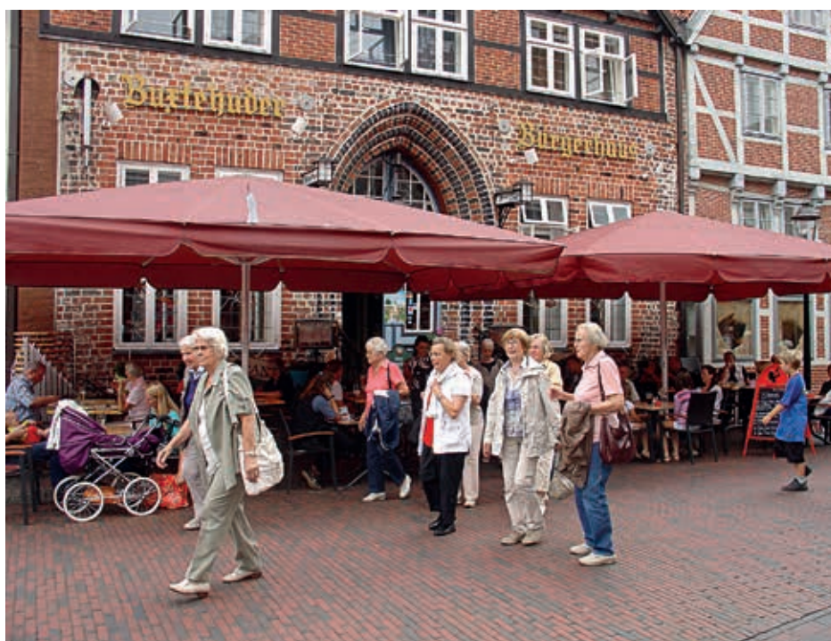
Blick auf die Bürgerstuben