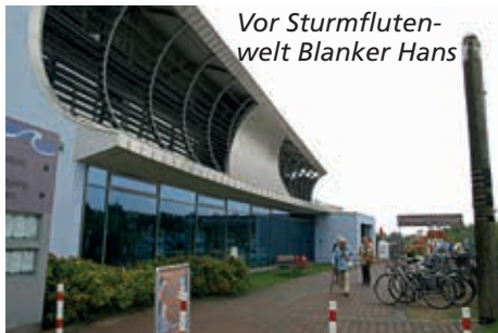
Vor Sturmflutenwelt Blanker Hans