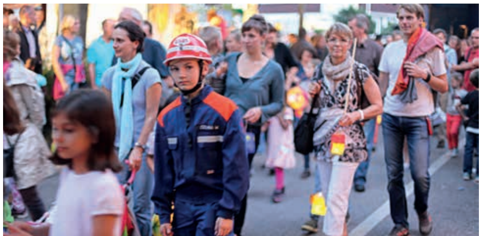
Behütet von der Jugendfeuerwehr und musikalisch geführt vom Spielmannszug, so folgten Hunderte von kleinen und großen Teilnehmern dem Laternenumzug in die Horstniederung, wo zum Abschluss ein beeindruckendes Feuerwerk den Himmel erhellte.