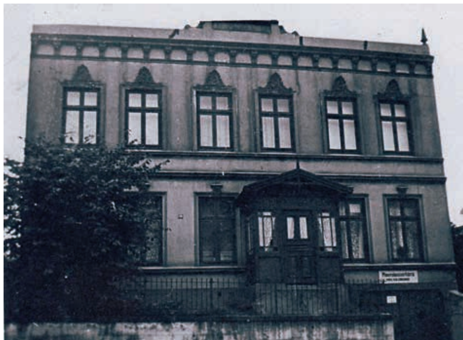
Das gesuchte Haus – wo stand es, was war das Besondere?

Nächster Redaktionsschluss ist der 31.10.2014