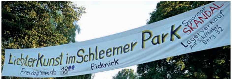
LiKu Sponsor SKANDAL

Grünanlage Möllner Landstraße, Ecke Kapellenstraße, Eintritt frei