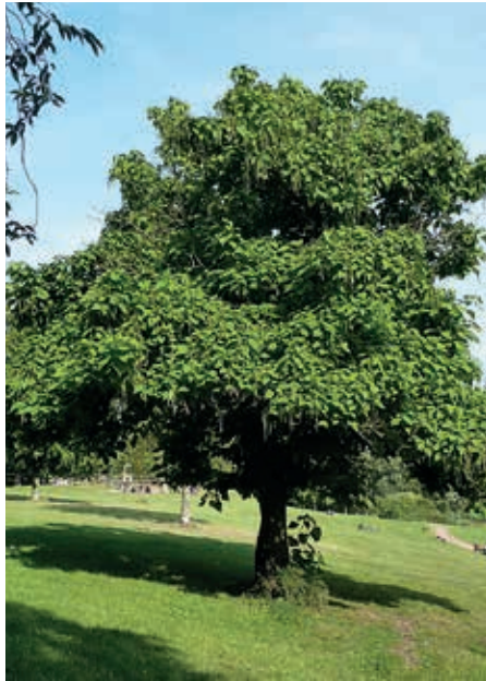
Trompetenbaum – Hingucker oberhalb der Glinder Au

„Wo steht dieser Solitär und wie heißt er?“, lautete die letzte Rätselfrage. Frau Grabichler antwortete sehr schnell: „Der gesuchte Baum steht in Kirchsteinbek, an der Glinder Au in dem kleinen Park längs der Straße ungefähr in der