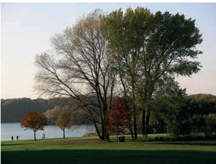
Billstedter lieben auch die Idylle des Öjendorfer Sees

ist stellvertretender Chefredakteur bei hh-mittendrin.de. In einem früheren Leben war Brück Offizier der Bundeswehr. Jetzt arbeitet er bei Mittendrin und als freier Journalist, unter anderem für die taz, stern.de und ZEIT ONLINE. Darüber hinaus arbeitet er in der Politischen Bildung. http://www.hh-mittendrin.de