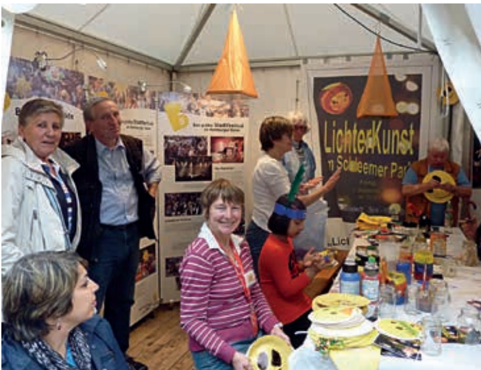
Schon auf dem NDR-Sommerfest wurde für die LichterKunst im Schlemer Park gebastelt. Bravo Billstedt!

Die liebe Seite Billstedts. Manchmal kramt aber nur zu gerne die Schattenseiten hervor (siehe Nachsatz zum Artikel „Typisch Billstedt“)