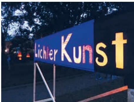
Im Dunkeln wirkt es am besten...