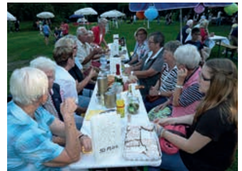
Am eigenen Lichtertisch bringt's noch mehr Spaß

Am Freitag, dem 5. September, veranstaltet die Initiative „Wir für Billstedt“ wieder einmal die „LichterKunst im Schleemer Park“. Nach dem Motto „Mitmachen und genießen“ sind alle Gäste herzlich eingeladen, den Park ab 18 Uhr gemeinsam mit selbst gebastelten Lichtobjekten zu schmücken. „Wir hoffen, dass viele Besucher kreativ werden und ihre eigenen Lichtobjekte (nur Kerzenbe-