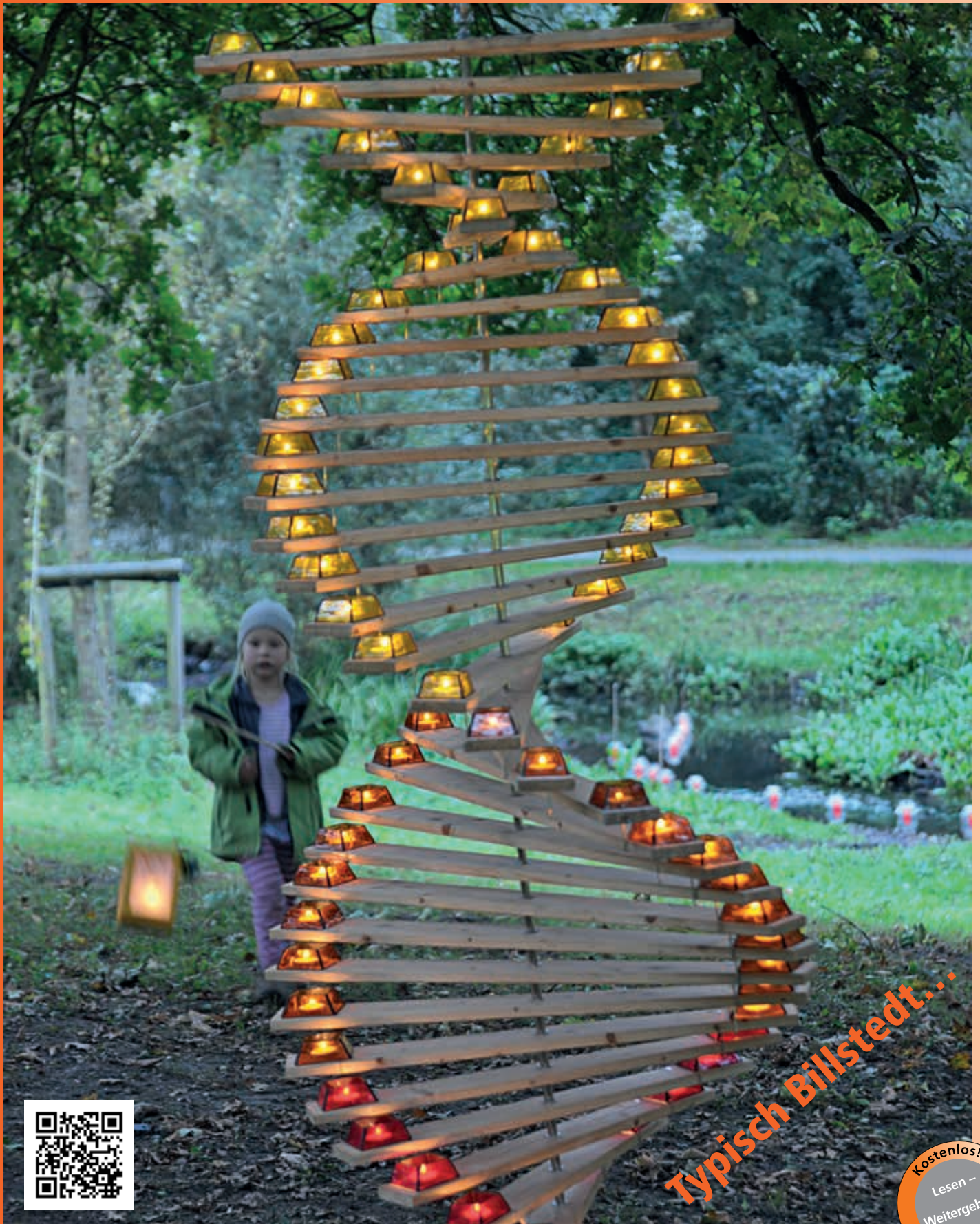
Am 5. September erleuchtet wieder die LichterKunst den Park am Schleemer Bach

Zeitschrift des Bürger- und Kommunalvereins Billstedt von 1904