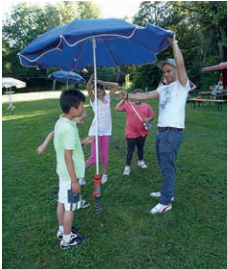
Auch der Aufbau macht schon Laune