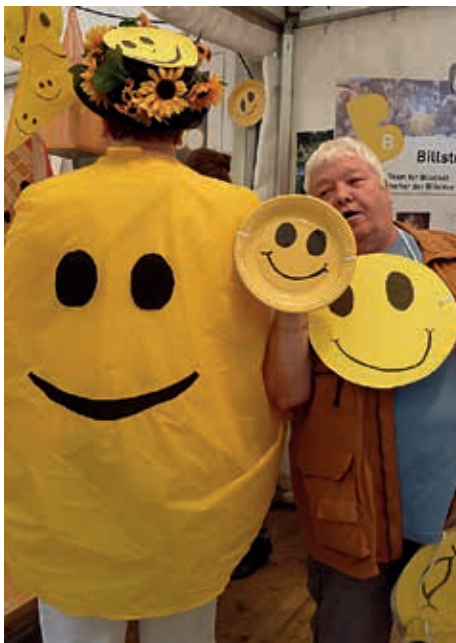
Nicht nur die NDR-Sommertour-Wette gewonnen, sondern ganz Billstedt zum Smilen (Lächeln) gebracht...

Fünf Tage lang stand Billstedt im Mittelpunkt: Die „Sommertour“ des NDR machte es möglich. Und die Billstedter Menschen gewannen ganz locker die Wette, mindestens 500 große Smileys tanzend vorzuzeigen, und hatten viel Spaß dabei. 13000 Menschen waren auf der Billstedter Hauptstraße dabei!