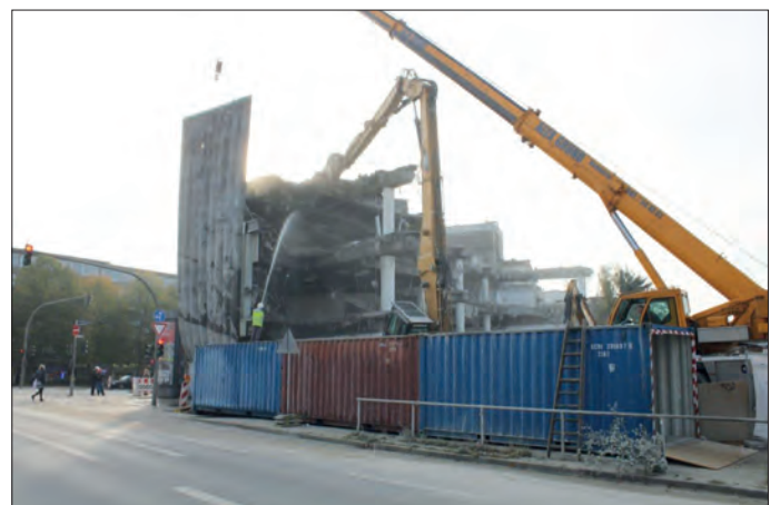
Ein Gigant verschwindet: Auf diesem Bild ist von dem Kaufhausgebäude fast nicht mehr übrig.

Der Abriss des Gebäudes wurde fast täglich von zahlreichen Schaulustigen und Fotografen verfolgt. Ungewohnte „Weitsicht“ haben nun einige Anwohner, die in umliegenden Gebäuden wohnen: Durch den Abriss des Giganten haben sie freien Blick auf den Bahnhof dahinter. Aber auch umgekehrt ist dies der Fall: Vom Bahnsteig der S-Bahn beispielsweise kann man Anliegen fast ins Wohnzimmer schauen.