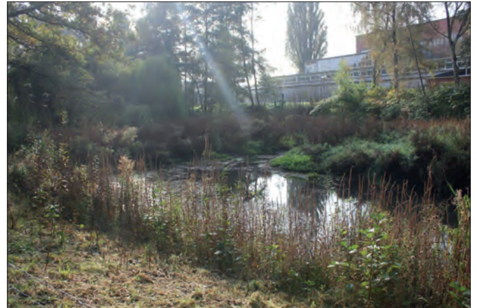
Ein Miniparadies direkt hinter Hauptverkehrsstrasse und U-Bahn-Gleisen: Das Rückhaltebecken der Seebeck.

In der letzten Ausgabe wurde ausführlich über das große Rückhaltebecken der Seebek, den Appellhoffweiher, berichtet. Doch auch in entgegengesetzter Richtung verfügt die Seebek über ein Rückhaltebecken. Dieses fällt zwar deutlich kleiner aus, dafür ist die Umgebung nicht weniger idyllisch und von vielen Bramfeldern kaum gekannt. Wenn man die Grenze von Barmbek nach Bramfeld überschritten hat und man sich auf der Bramfelder Chaussee befindet, die hier beginnt, dann sieht man linker Hand das bekannte kleine Einkaufszentrum Zebra, an der Ecke zur Fabriciusstraße. Genau gegenüber allerdings direkt neben der Schiffbauversuchsanstalt fließt ein kleines Rinnsal: Die Seebek. Wenn man dem Sandweg folgt und zwischen U-Bahn Gleisen und Schiffbauversuchsanstalt entlang geht, dann ist man in wenigen Schrit-