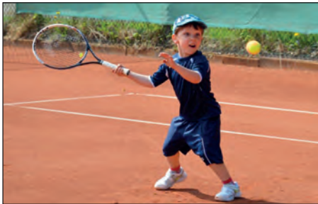
Die Jugendarbeit steht in der kommenden Saison im Mittelpunkt des Tennis- u. Hockeyclub am Forsthof e.V.

Der 1959 gegründete Tennis- und Hockeyclub am Forsthof e.V. (THC am Forsthof) verfügt über eine schöne Tennisanlage direkt am Bramfelder See. Die 10 Sandplätze stehen sowohl für Freizeittennis, Einzel- und Gruppentraining als auch für Wettkämpfe zur Verfügung. Eine Tennishalle mit weiteren drei