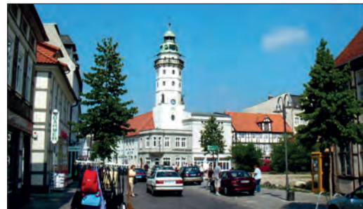
Der Kosten- Altes Rathaus in der Neustadt.

aus organisatorischen Gründen nicht berücksichtigt werden.