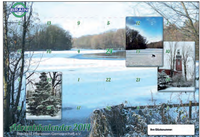
So sieht der Adventskalender 2014 aus.

In diesem Sommer freute sich die Stadtteilschule Bramfeld über den Erlös des Adventskalenders vom letzten Jahr. Sie konnte sich rechtzeitig zu ihrem 225jährigen Jubiläum ein Maskottchen anschaffen. Im Vorwege hatte die Schule unter den Schülern ein Wettbewerb für die Suche nach einem passenden Maskottchen ausgerufen. Aus den vielen Entwürfen wählte eine Jury, bestehend aus Mitgliedern des Festausschusses, Kunstlehrern und Mitgliedern des Schülerrats, schließlich den Gewinner: einen Löwen. Alle Kosten für die Herstellung des neuen Maskottchens konnten vom Erlös des Adventskalenders getragen werden, insgesamt 647 Euro. Und so hatte der Löwe seinen er-