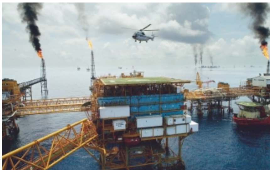
Ölplattform im Golf von Mexiko, hier wird Öl bis in Tiefen von über 1500 Metern gefördert.

Das Foinaven-Feld westlich der Shetlands, erst 1992 entdeckt, liegt rund 500 Meter unter dem Meeresspiegel. Bei solchen Wassertiefen wird oft auf so genannte schwimmende Förder- und Produktionseinheiten zurückgegriffen. Diese aber gelten laut Shell als „relativ stark wetterabhängig“ – in einer Region nahe der Shetlands, in der von Oktober bis April ein Sturmtief das nächste jagt, also ein riskantes Unterfangen. Kommt es zu einem Unfall, könnte der Ölteppich innerhalb von 48 Stunden die Shetland- und die Orkney-Inseln erreichen. Nicht nur die berühmten Vogelreservate, sondern auch die wirtschaftliche Zukunft der Inselbewohner – basierend auf Fischerei, Lachszeit und Tourismus – wäre dann bedroht.