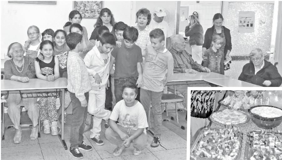
Stolze Köch/innen mit ihren Gästen beim Abschlussessen