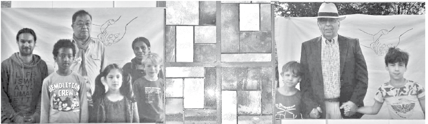
Ausstellung der Fotos von den Begegnungen in der Kirche Zu den zwölf Aposteln.