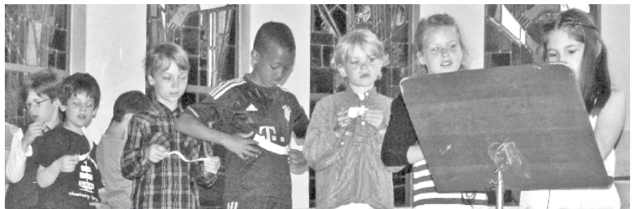
Die Schulkinder lesen ihre Begegnungsgeschichten in der Kirche Zu den Zwölf Aposteln vor.

lichste Menschen miteinander sprachen und feierten. Einen Ausklang fand das Fest bei schönstem Sommerwetter am Buffett und im Garten.