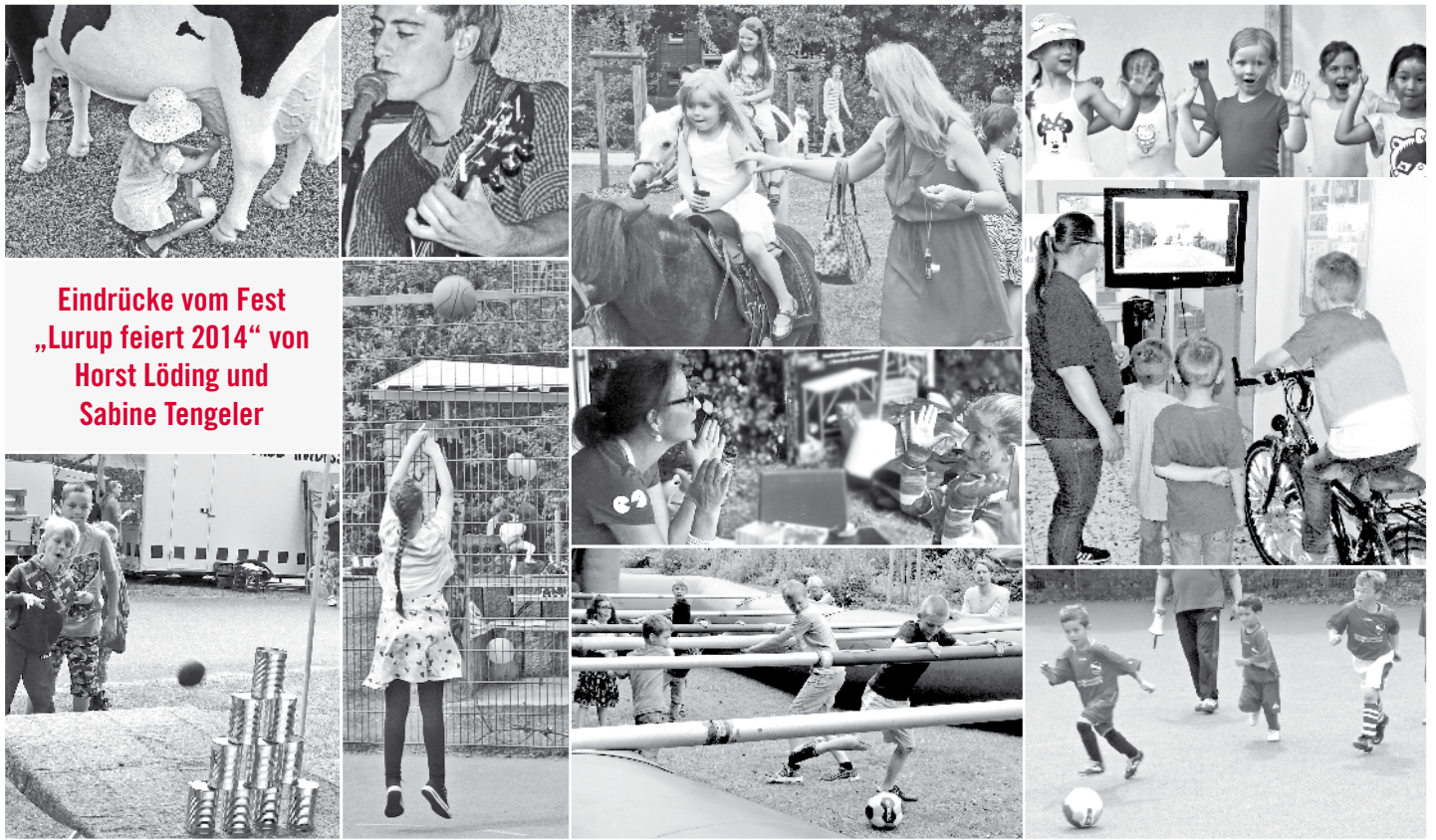
Eindrücke vom Fest „Lurup feiert 2014“ von Horst Löding und Sabine Tengeler