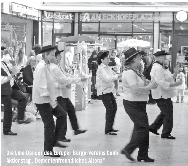
Die Line Dancer des Luruper Bürgervereins beim Aktionstag „Demenzfreundliches Altona“