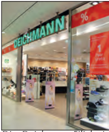
Die Deichmann-Filiale in der Marktplatz Galerie ist der Anlaufpunkt wenn es um Schuhe geht

Für viele Bramfelderinnen und Bramfelder, die für die ganze Familie günstig Schuhe kaufen möchten, führt der erste Gang häufig zu Deichmann in der Marktplatz Galerie – und das zu Recht. Topaktuelle Schuhmode kombiniert mit günstigen Preisen lockt nicht nur die ganze Familie an, sondern auch junge Erwachsene und Teenager.