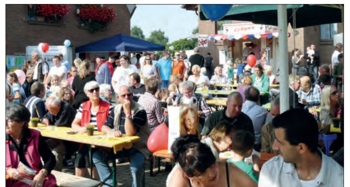
Auch in diesem Jahr werden sicher sehr viele Besucher zum Bramfelder Fenster kommen - wie hier im vergangenen Jahr.

Gascontrol - Tel. 040-2513682 - www.gascontrol.de Wartung - Reparatur - Gerätetausch