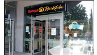
Hier in der Kamps Backstube wird frisch gebacken und frisch verzehrt.

Kollegen holt, sich nach dem Einkaufsbummel mit etwas Deftigem stärkt, oder ob man später zur Kaffeezeit die leckeren Teilchen und Kuchen bei einer Tasse Kaffeespezialität genießt. Laugenbrezel, Käse-Seele oder der beliebte Fanblock – ob Franzbrötchen, Berliner oder Puddingbrezel – wenn man in der Marktplatz Galerie Bramfeld unterwegs ist, dann kommt man an der