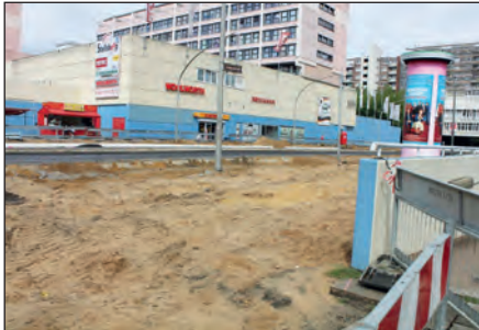
Hier sollen im Winter wieder Autos, Busse und Radfahrer den fließenden Verkehr genießen. Noch sieht es nicht danach aus.

Kaum zu übersehen: an einem der zentralsten Verkehrspunkte in Steilshoop wird zur Zeit nicht nur einfach gebaut, sondern im wahrsten Sinne gebuddelt. Aber was genau geschieht dort mitten in Steilshoop? Die vierspurige Gründungsstraße in Steilshoop wird vom Eichenlohweg bis zum Borcherting neu geordnet. Dem Verkehrsaufkommen entsprechend wird es je Fahrtrichtung künftig nur noch einen Fahrstreifen geben. Für den Radverkehr werden beidseitig Schutzstreifen angelegt. Sämtliche Ampelanlagen entfallen. Stattdessen werden drei Kreisverkehre eingerichtet, zum sicheren Queren der Straße werden Sprung- und Mittelinseln angelegt. Sämtliche Bushaltestellen werden an den Fahrbahnrand verlegt. Für den Einsatz von Doppelgelenkbussen werden sie verlängert und modernisiert. Und warum der Aufwand? Allein in der Gründungsstraße wird der Bus durch sechs Ampeln ge-